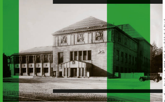
Kunsthhaus Zürich nach 1925