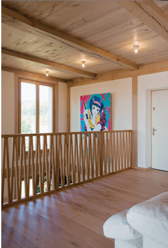
^Die Galerie des zweigeschossigen Gemeinschaftsraumes.