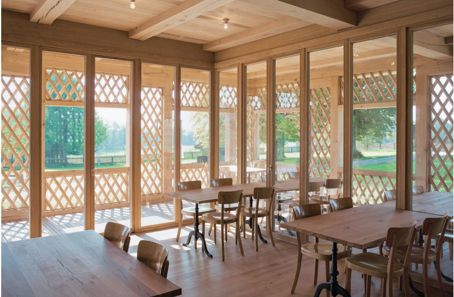
^Vom stützenfreien Restaurant geht der Blick über die Loggia auf die weite Lichtung.