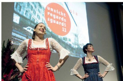
^«Nüsslialat demokratisiert den Staat», sang das Duo Edeldicht zur Erheiterung des Publikums.