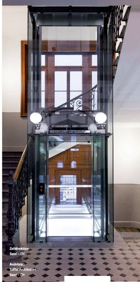
Zolldirektion Basel – CH Architekt: Toffel Architekten Basel – CH