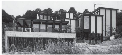
^Filigrane Holzskelett-Struktur: Das Dreifamilienhaus in Obersiggenthal von 1975.