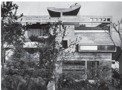
^Das Atelierhaus an der Zürcher Rebbeggstrasse von 1963, der bekannteste Bau von Hans Demarmels.

Hans Demarmels löste sich früh von einer Stilgebundenheit. Er entwickelte die architektonische Ausdrucksweise seiner Gebäude in verschiedenen Schaffensphasen weiter. Stark beschäftigte er sich mit einer eigenen Struktur der Innenräume, die er in all seinen Bauten umsetzte. Sein bekanntestes Werk, das eigene Atelierhaus an der Rebbeggstrasse in Zürich, spricht die raue Sprache des architektonischen Brutalismus. Demarmels baute es zusammen mit zwei Mehrfamilienhäusern in den Jahren 1963 bis 1965. Das kubistisch anmutende Gebäude in Sichtbeton zeigt eine virtuose plastische Formensprache. Der in den Hang gesetzte Baukörper löst seine monolithische Struktur vom Sockel gegen das Dach hin zu einer linearen Balkenstruktur auf. Im Gebäudeinnern dominiert der in Beton gegossene Kern mit Kamin und Treppenanlage. Darum herum gliedern sich die auf Halbgeschossen versetzten Räume, die sich plattformartig in einem Raumkontinuum anordnen. Dieses Thema findet sich in fast allen seiner Gebäude wieder.