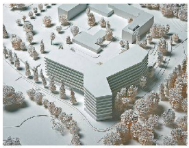
<5_Hauptsitz von The Global Fund.