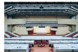
^17_Centre International de Conférences de Genève.