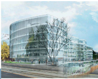
<6_Maison de la Paix.