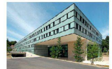
^14_Nebau UNAIDS WHO.