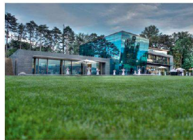
>11_Erweiterungsbau World Economic Forum.