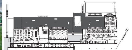
^11_World Economic Forum, Grundriss.