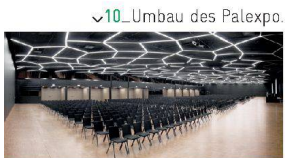
✓10_Umbau des Palexpo.