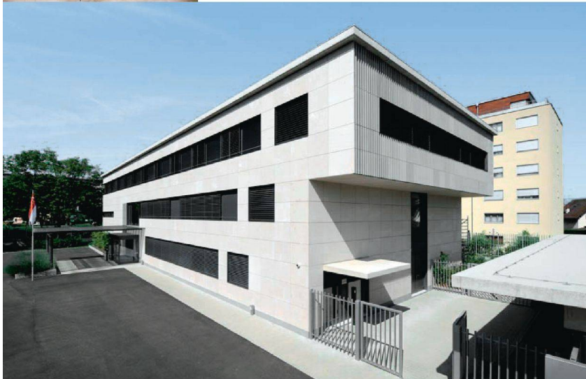
<12_Ständige Vertretung von Singapur.