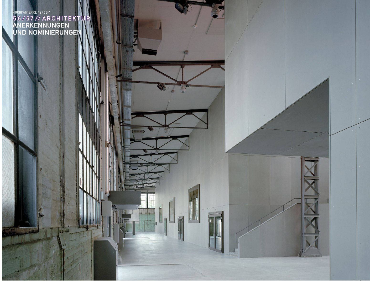
^22_Aus der Weichenbauhalle in Bern wurde ein Hörsaalgebäude.