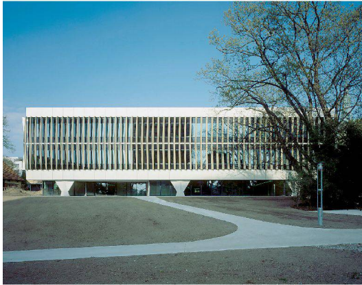
∨52_Institutsgebäude der Pathologie und Rechtsmedizin.