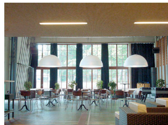
58_Jugendbeiz in der Turnhalle Talhof.