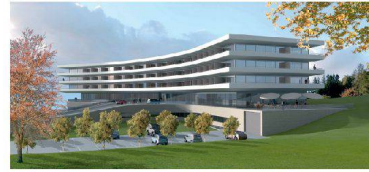
<50_Oberwaid Kurhaus (Visualisierung).