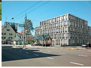
>51_Regionales Blutspendezentrum (Visualisierung).