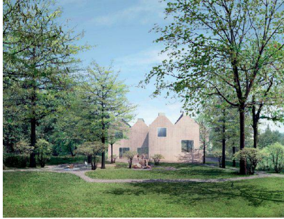
<49_Nebau Naturmuseum (Visualisierung).