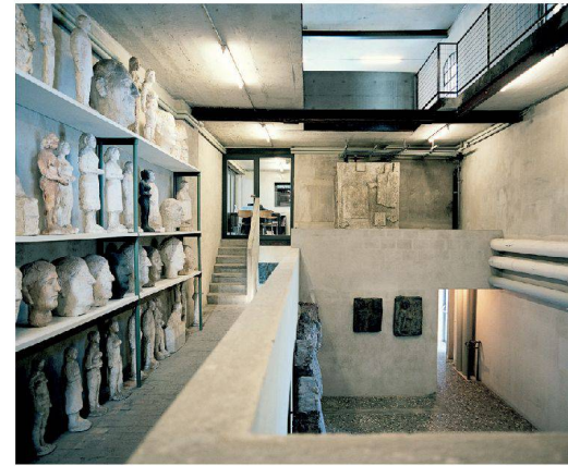
^55_Kesselhaus mit dem Schaulager Josephsohn.