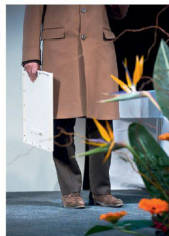
>Stilleben mit Urkunde, Lammfellmantel und Papageienschnäbel.