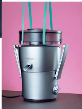
50__ Schlicht geformt: Turmix- Entsafter.