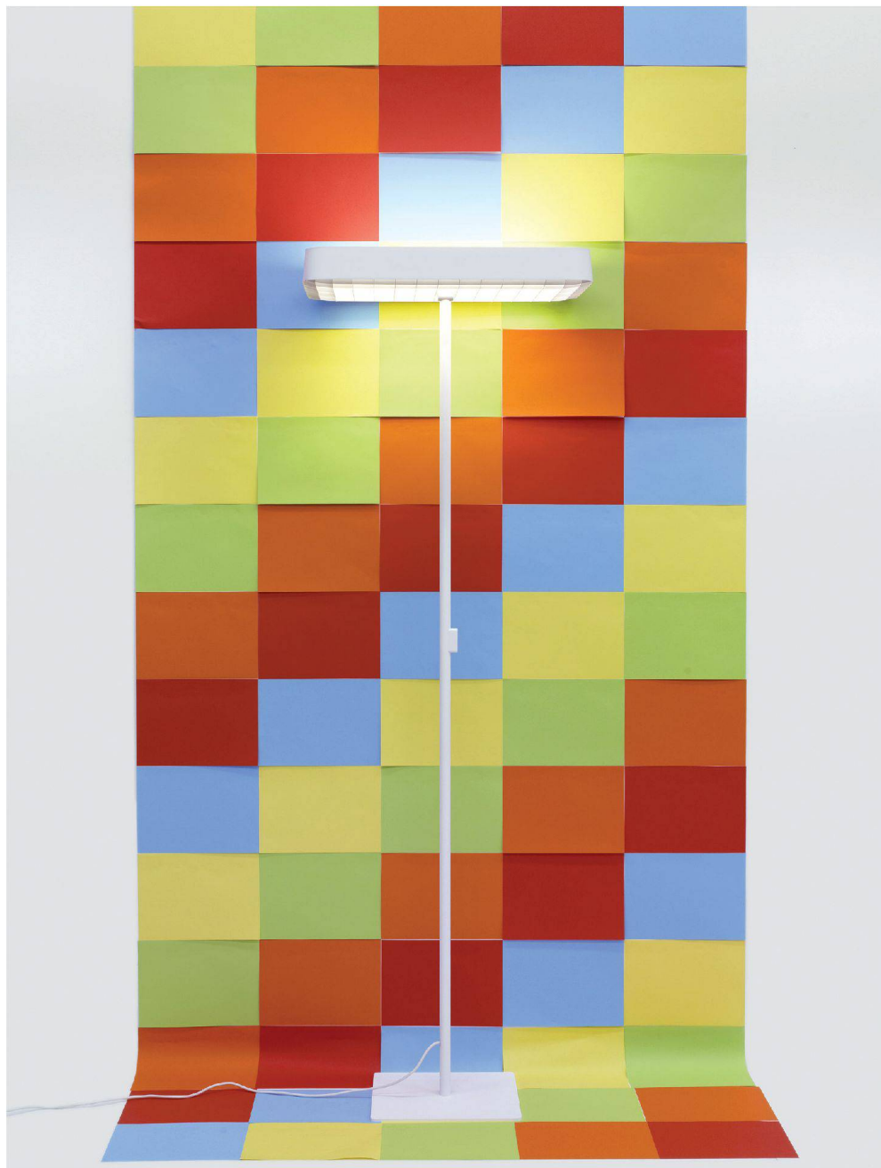
^Schlankes Metallrohr, kräftiger Kopf: In diesem Fall leuchten hocheffiziente Fluoreszenzröhren.