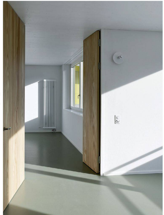
>Die zwei Türflügel schwingen in verschiedene Richtungen.