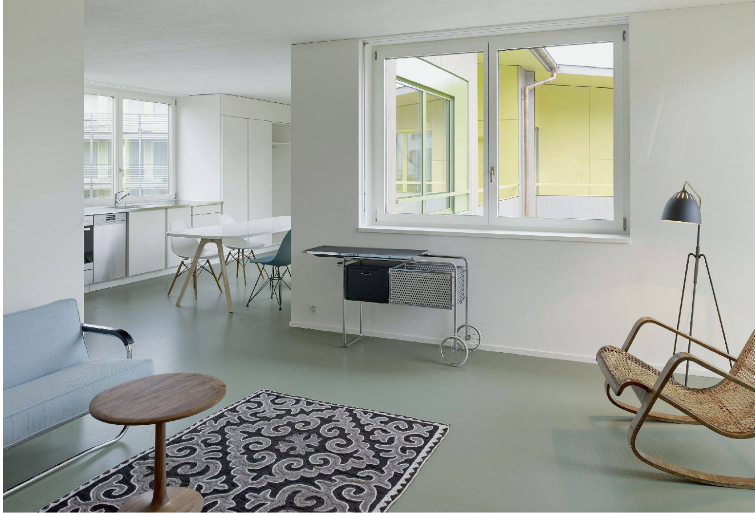
^Direkt und selbstverständlich: Offene Räume schauen sich gegenseitig in die Fenster.