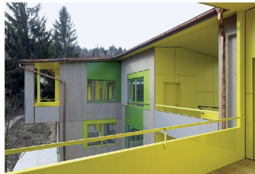
^An seiner Rückseite machen Einschnitte den Baukörper kleinteilig.