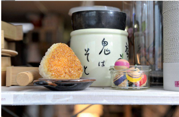
^In den Regalen und auf den Ablagen gab es einiges zu entdecken: vom Plastik-Sushi bis hin zu Origami-Pommes.