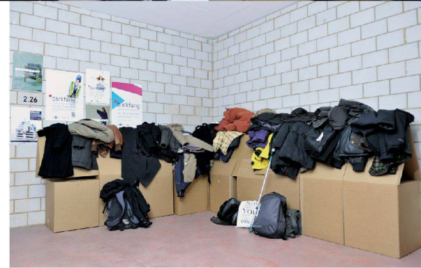
^Die improvisierte Garderobe im Vorraum des Ateliers.