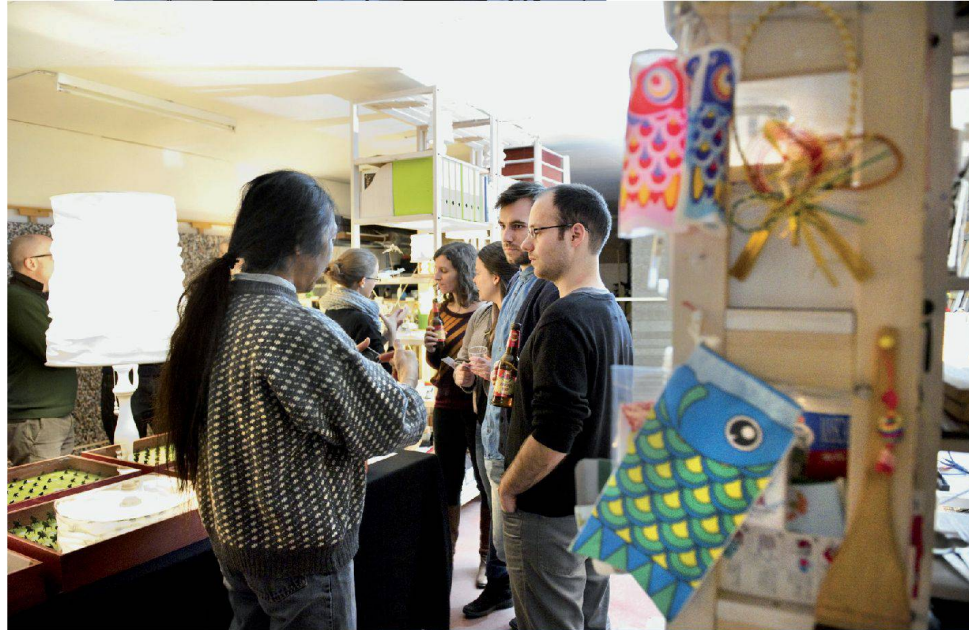
^Das Atelier 2.26 im Gewerbehause Gleis 70.