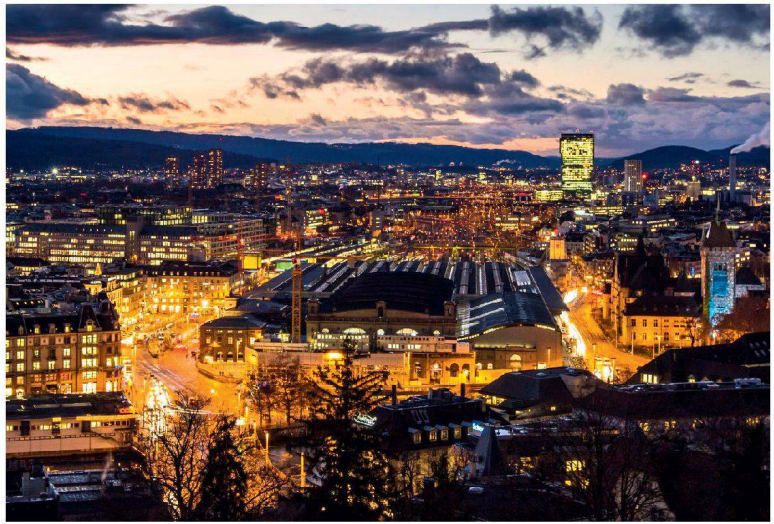
12.12.2011, 17.08 Uhr. In den Städten führt der Nachtbetrieb zu immer mehr Lärmklagen. Fotostandort? Auflösung auf der folgenden Seite.