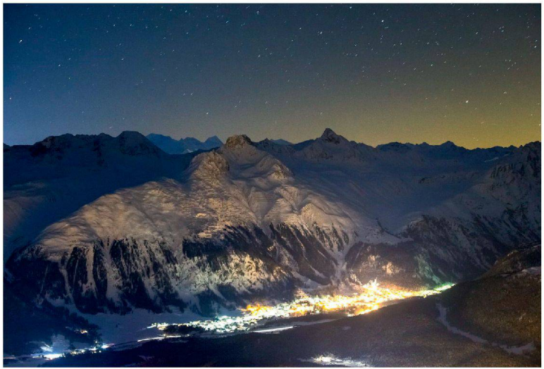
12.12.2012, 23.11 Uhr. Die Lichtinfrastruktur des Tourismus ist gewaltig. Der Schnee vervielfacht ihr Strahlen. Fotostandort? Auflösung auf Seite 51.

Die Nacht ist in der Raumplanung kaum ein Thema. Was nachts passiert, kann quantitativ nicht mit den Tagesaktivitäten mithalten. Doch war es nachts bis ins 20. Jahrhundert hinein in Dörfern und Städten ruhig, ist das nächtliche Leben heute fast so pluralistisch wie jenes am Tag. Welche Spuren hinterlässt dies im Raum? Welche Folgen hat es für die Raumplanung? Eine Sammlung von Beobachtungen und Beispielen, fragmentarisch wie der in Lichtinseln zerfallende Raum der Nacht.