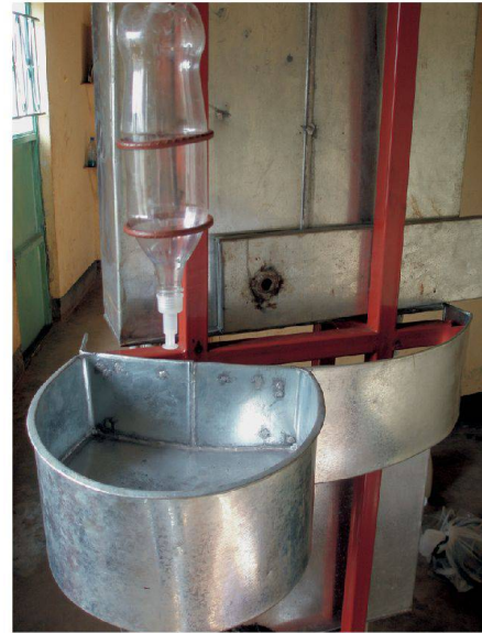
Zur Recherche des Designteams gehörte auch, mit lokalen Handwerkern abzuklären, was sie bauen können.