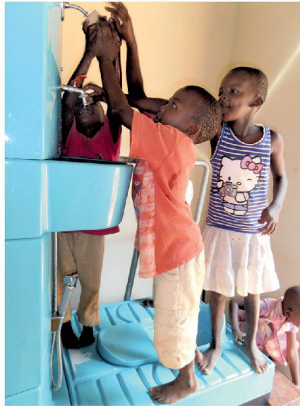
Kinder testen das Handwaschbecken der Blue Diversion Toilet.