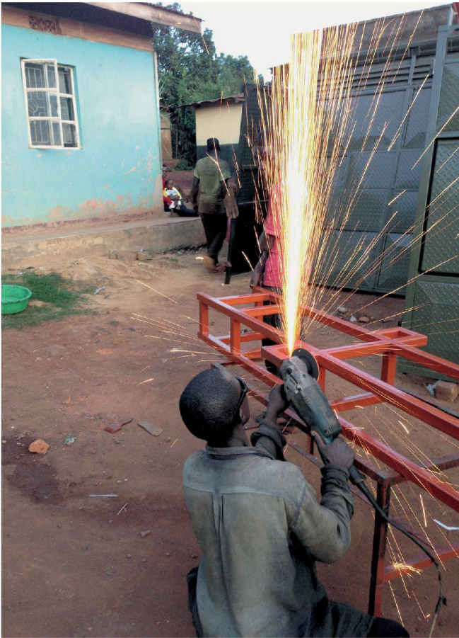
Produktion im Freien: Ein Handwerker bearbeitet mit einer Trennscheibe eine Stahlstruktur, wie sie für die Toilette gebraucht wird.