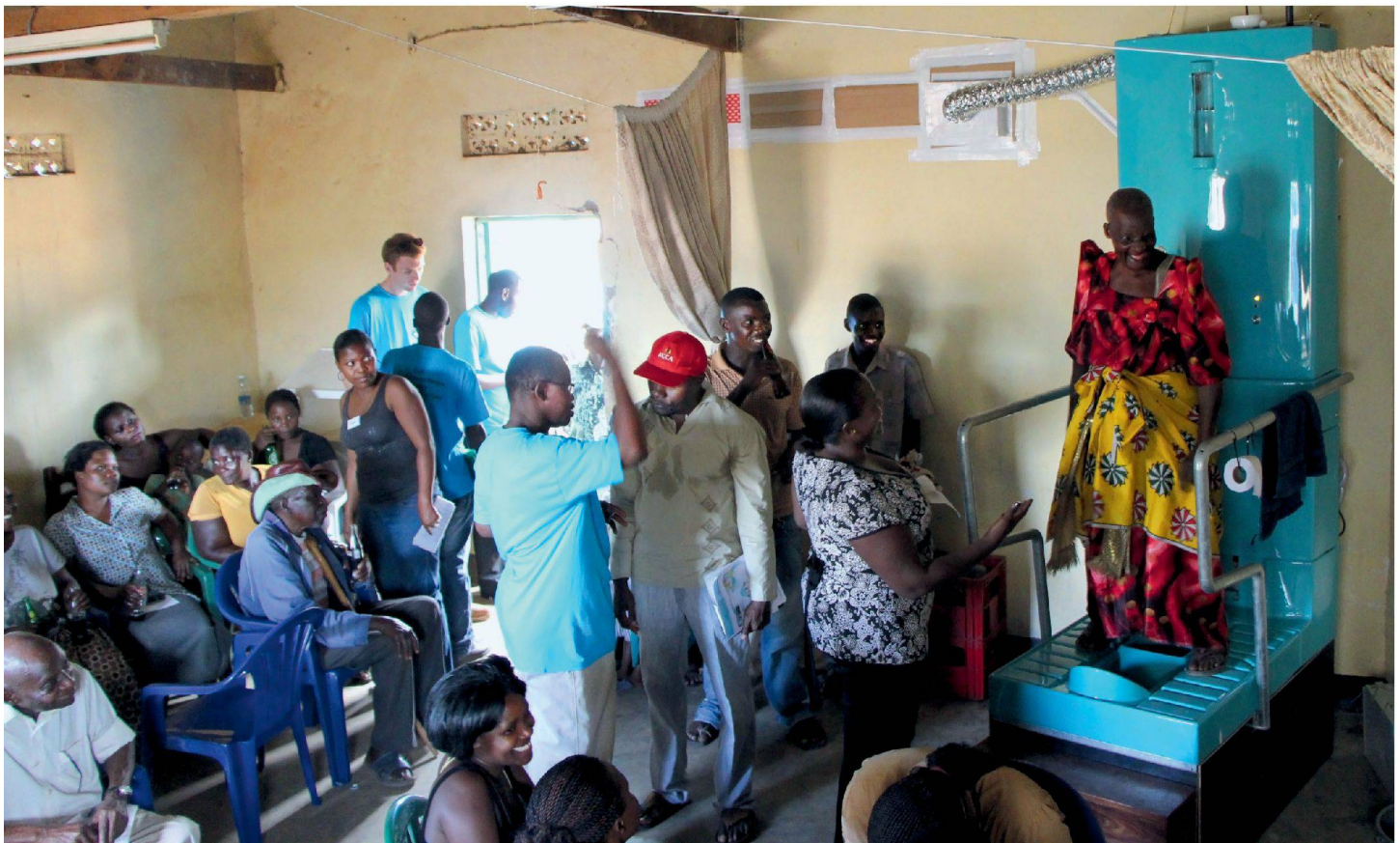
Eine Fokusgruppe begutachtet das Modell der Toilette in einem Gemeinschaftszentrum.