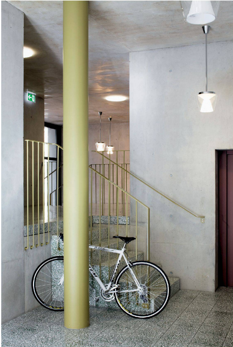
Im Innern fühlt sich der Gast oder die Bewohnerin nicht beengt.