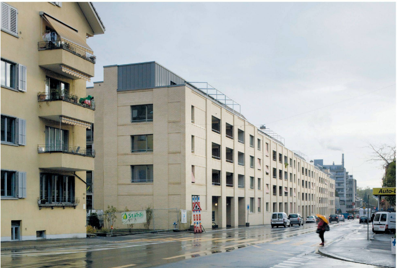
Eine laute Strasse in Bern und ein Haus, das sich ihr nicht verschliesst.