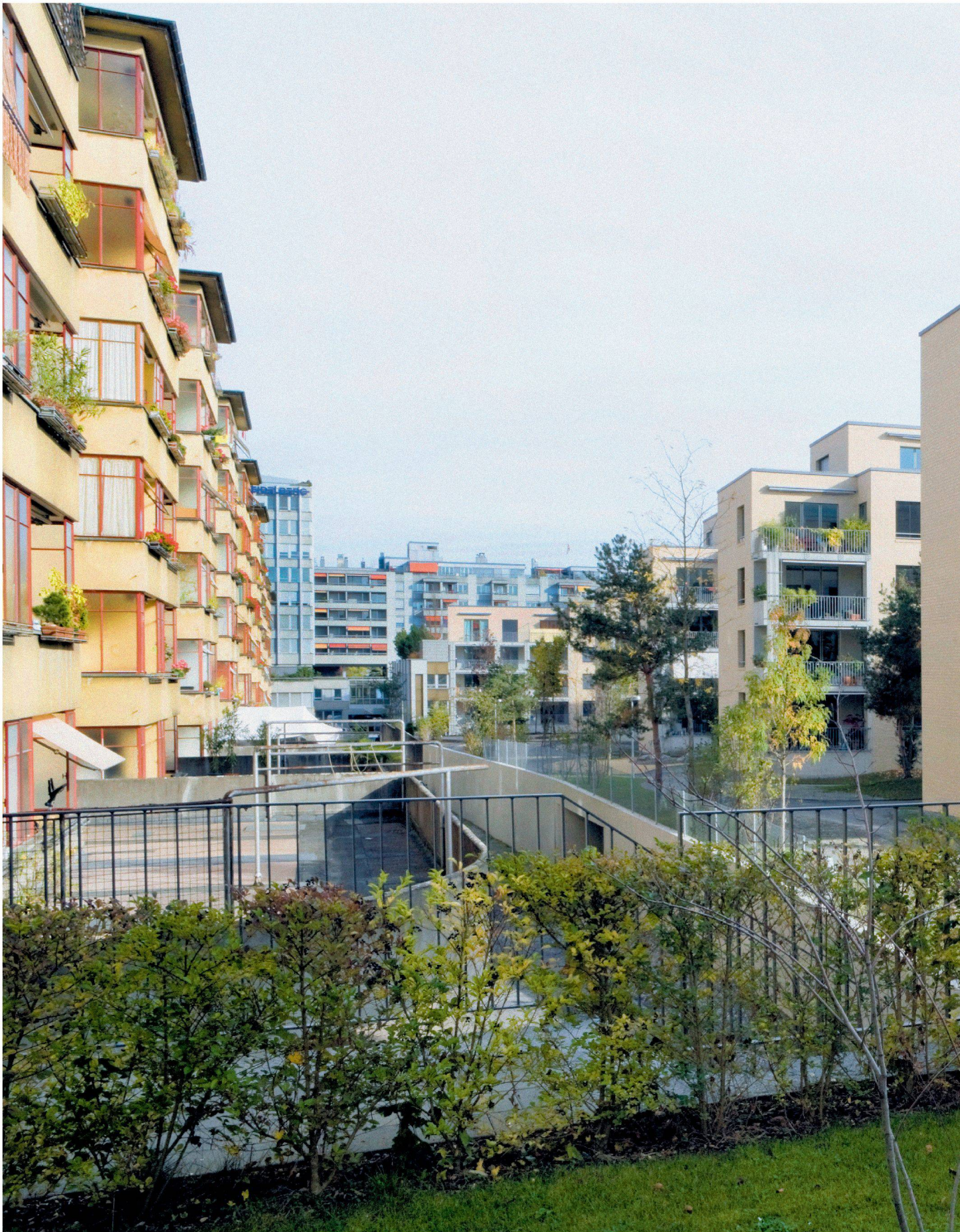
Mit fünf «Seitenhäusern» schiebt sich das Gebäude in den grünen Hof. Leider verbinden sich die Aussenräume, trotz gleicher Bauherrschaft gegenüber, nicht.