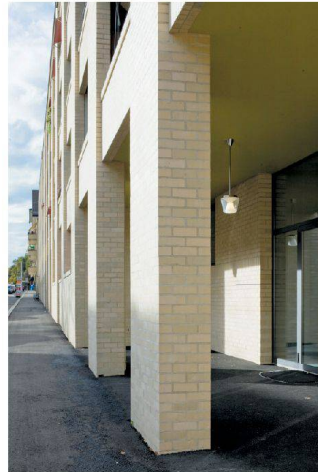
Die Eingangshallen öffnen sich zum Trottoir.