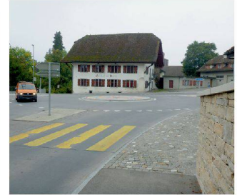
Ausbau Knoten Bären, Möriken AG SKK Landschaftsarchitekten