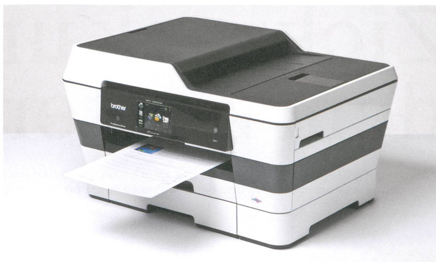
Der Business-Inkjetdrucker punktet mit seinem günstigen Seitenpreis, seiner Schnelligkeit und seiner Flexibilität.

Das formschöne Design zeichnet sich durch einen deutlich vergrösserten LCD-Touchscreen aus, dessen Menü sich intuitiv bedienen lässt. Neben dem kabellosen Ansteuern der Drucker über WLAN durch Workgroups können Ausdrucke und Scans auch über mobile Endgeräte angeordnet werden – einfach per Google Cloud Print, Apple AirPrint oder Brother iPrint&Scan. Der MFC-J6920DW ist zudem mit der «Near Field Communication»-Technologie (NFC) ausgestattet. Dies erlaubt das Austauschen von