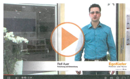
EgoKiefer Holz/Aluminium Hebeschiebetüre XL®2020 und EgoKiefer Kunststoff/Aluminium Hebeschiebetüre XL®2020.

Zu den Produktvideos: www.egokiefer.ch/innovationen