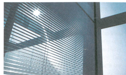
Sonnenschutz der Zukunft: ins Isolierglas integrierte Jalousie.

Grosse, bodentiefe Fenster prägen die moderne Architektur, sie sind Ausdruck der innovativen Wohntrends. Zudem ist das hindernisfreie Bauen von Gebäuden und Räumen seit vielen Jahren ein wichtiges Postulat, das bei Neubauten in jedem Fall und beim Modernisieren wenn immer möglich umgesetzt wird. EgoKiefer Hebeschiebetüren schaffen ein neues Raumgefühl und ermöglichen interessante planerische Perspektiven. Zudem zeichnen sie sich durch benutzerfreundliche Bedienung und hindernisfreie Schwellen aus.