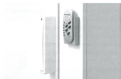
Motorantrieb für automatisches Öffnen und Schliessen von Hebeschiebetüren.