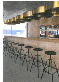
Die Bar des Mehrspur-Klubs unter der Rampe.