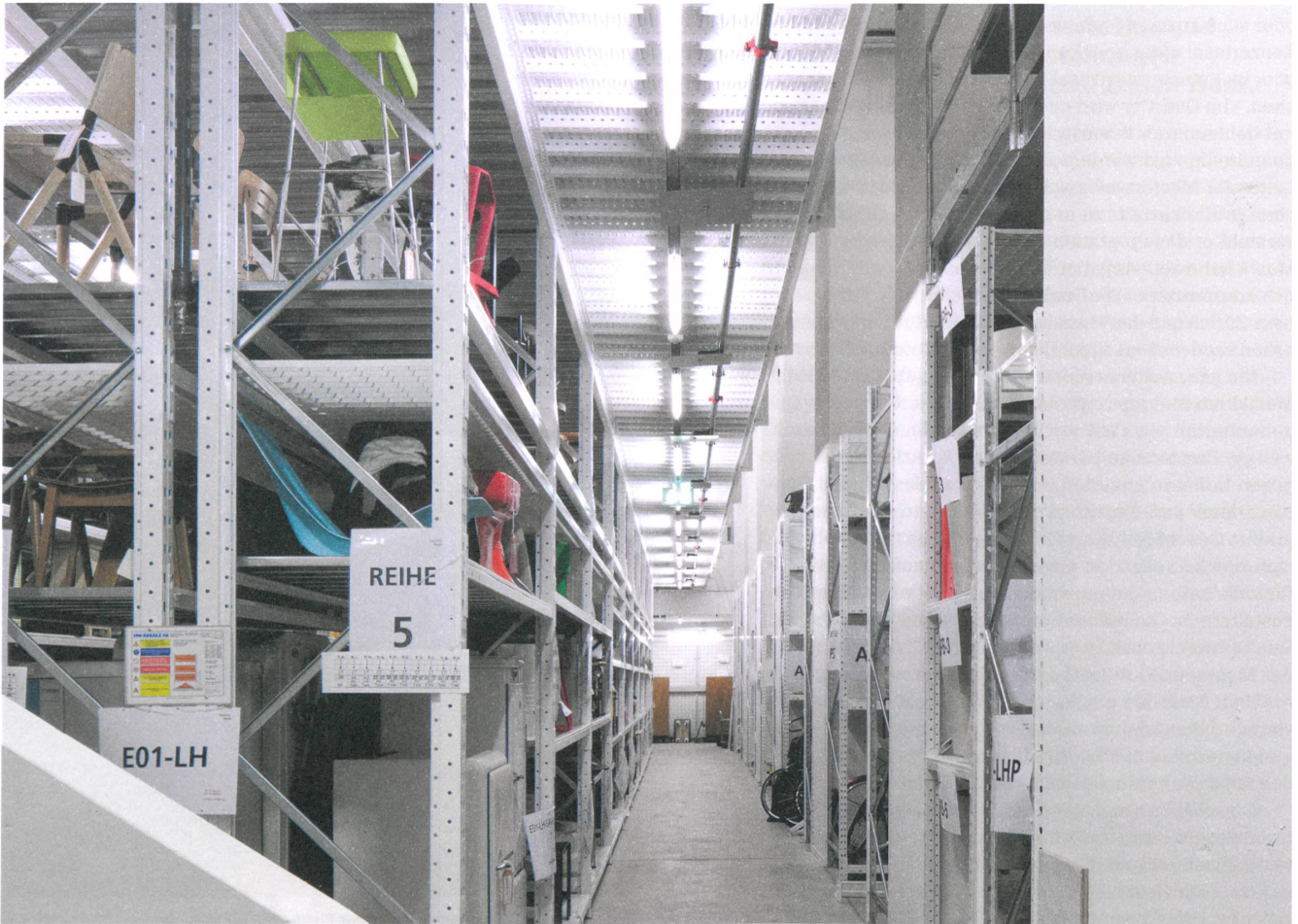
Sammeln und zeigen: Das Schaudapot des Museums für Gestaltung macht in den Katakomben des Toni-Areals auf 3700 Quadratmetern Designklassiker, Kunstgewerbeobjekte sowie Plakate und Grafiken sichtbar. Darüber werden in Wechselausstellungen Zusammenhänge und Themen aufgezeigt.