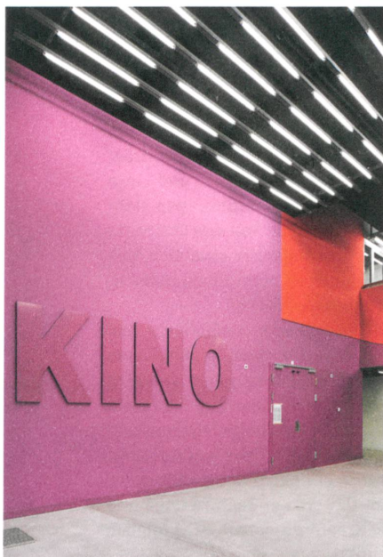
Im Kino zeigen Studierende ihre bewegten Bilder.