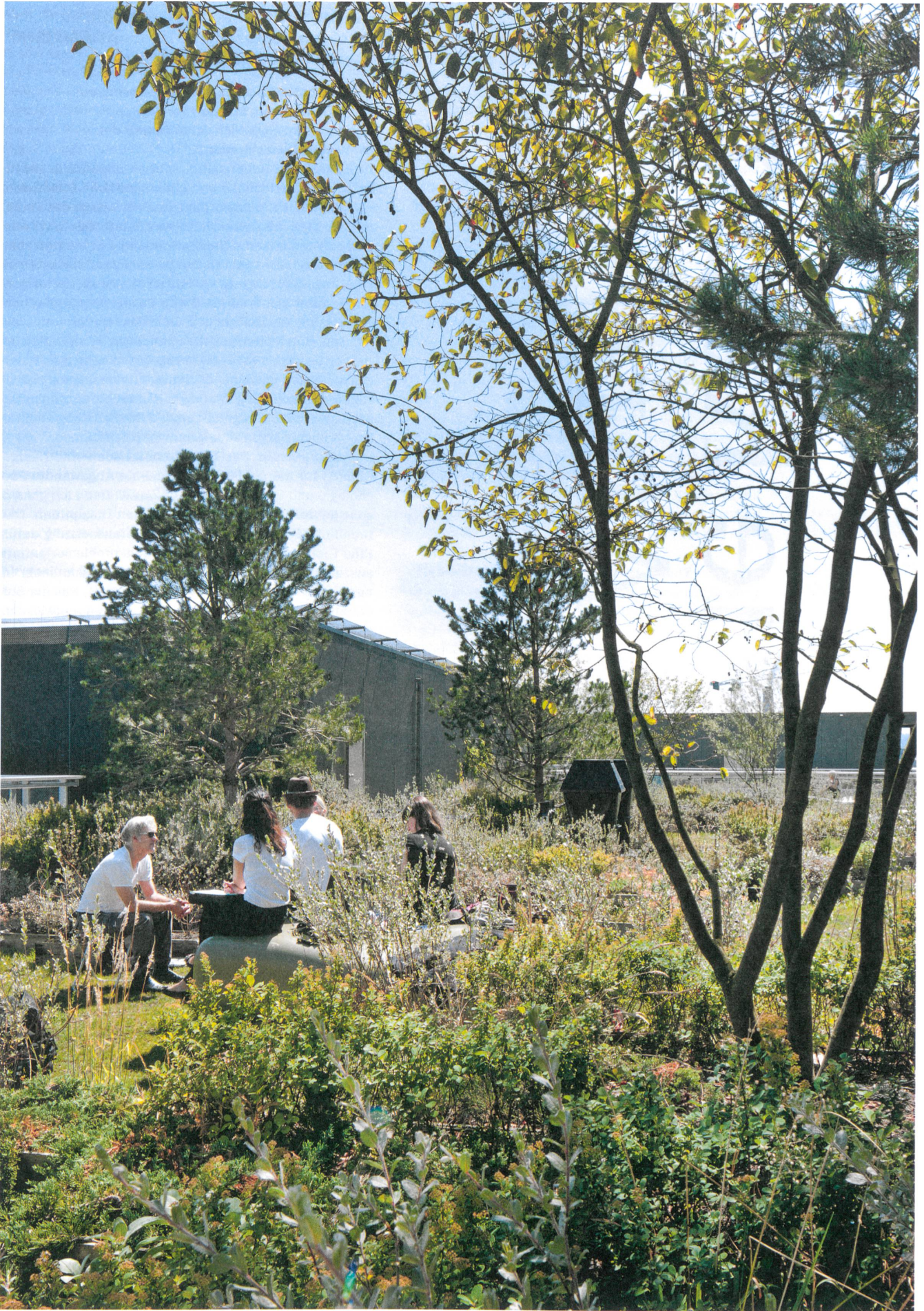
Grüne Lunge: Auf der öffentlich zugänglichen Dachterrasse spriessen Büsche und Sträucher, daneben arbeiten Studierende im Freien.