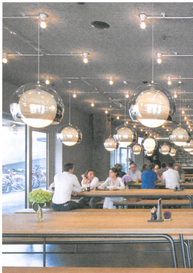
Treffpunkt neben dem Haupteingang: Das Bistro Chez Toni ist unter der Woche bis halb neun Uhr abends geöffnet.

Auch das Dach des Flachbaus ist während der Öffnungszeiten der Hochschulen ein Angebot ans Quartier. Sechs Geschosse oberhalb der Duttweilerstrasse wurde eine grosszügige Dachterrasse angelegt, ein grüner Freiraum mit weitem Blick über den Stadtteil, auf die mächtigen Verkehrsachsen und die vielgestaltigen Bauten der Umgebung. Der neue Park liegt mitten im urbanen Raum und ist dennoch für sich stehend. Die Terrasse bleibt zwar