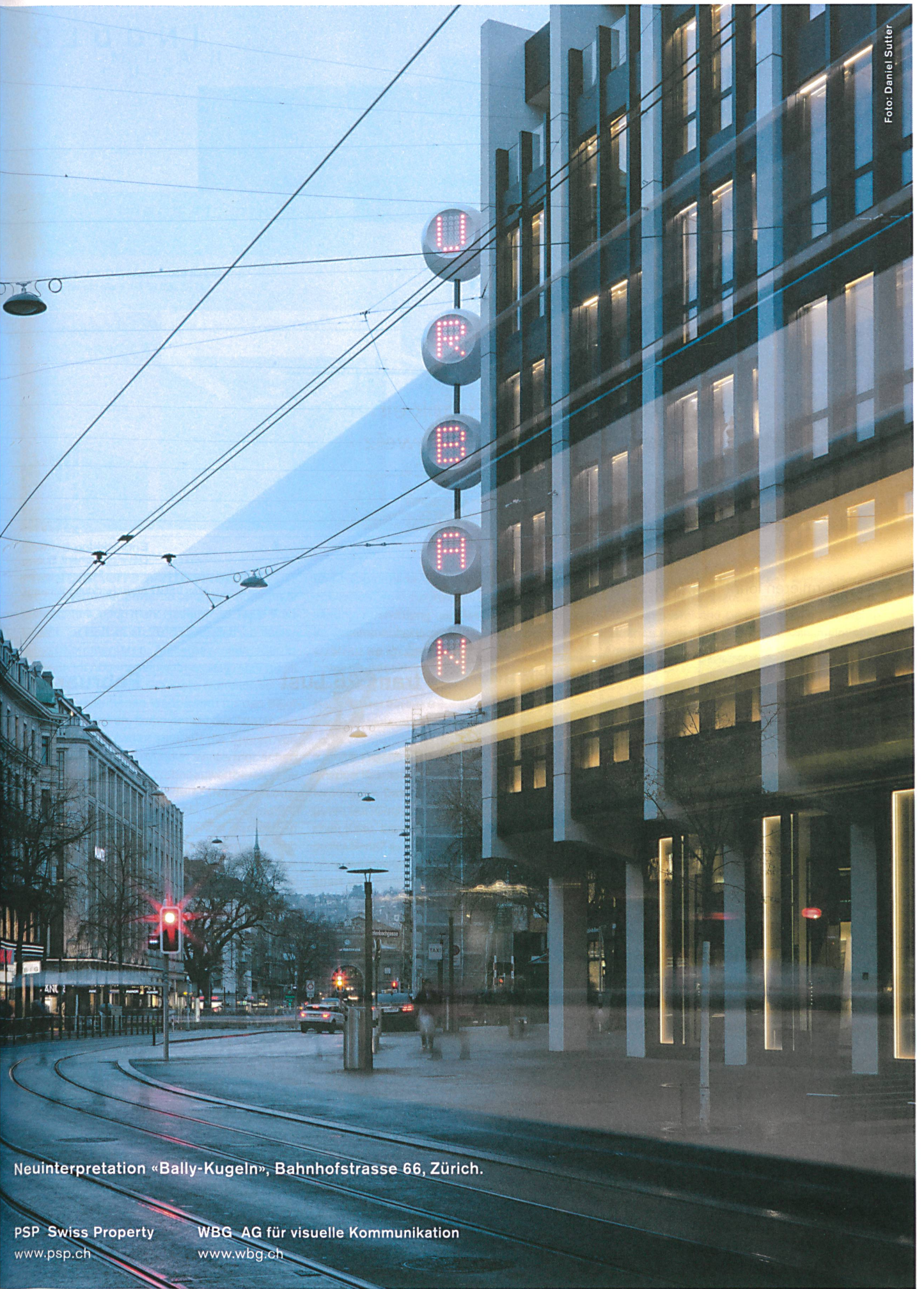
Neuinterpretation «Bally-Kugeln», Bahnhofstrasse 66, Zürich.