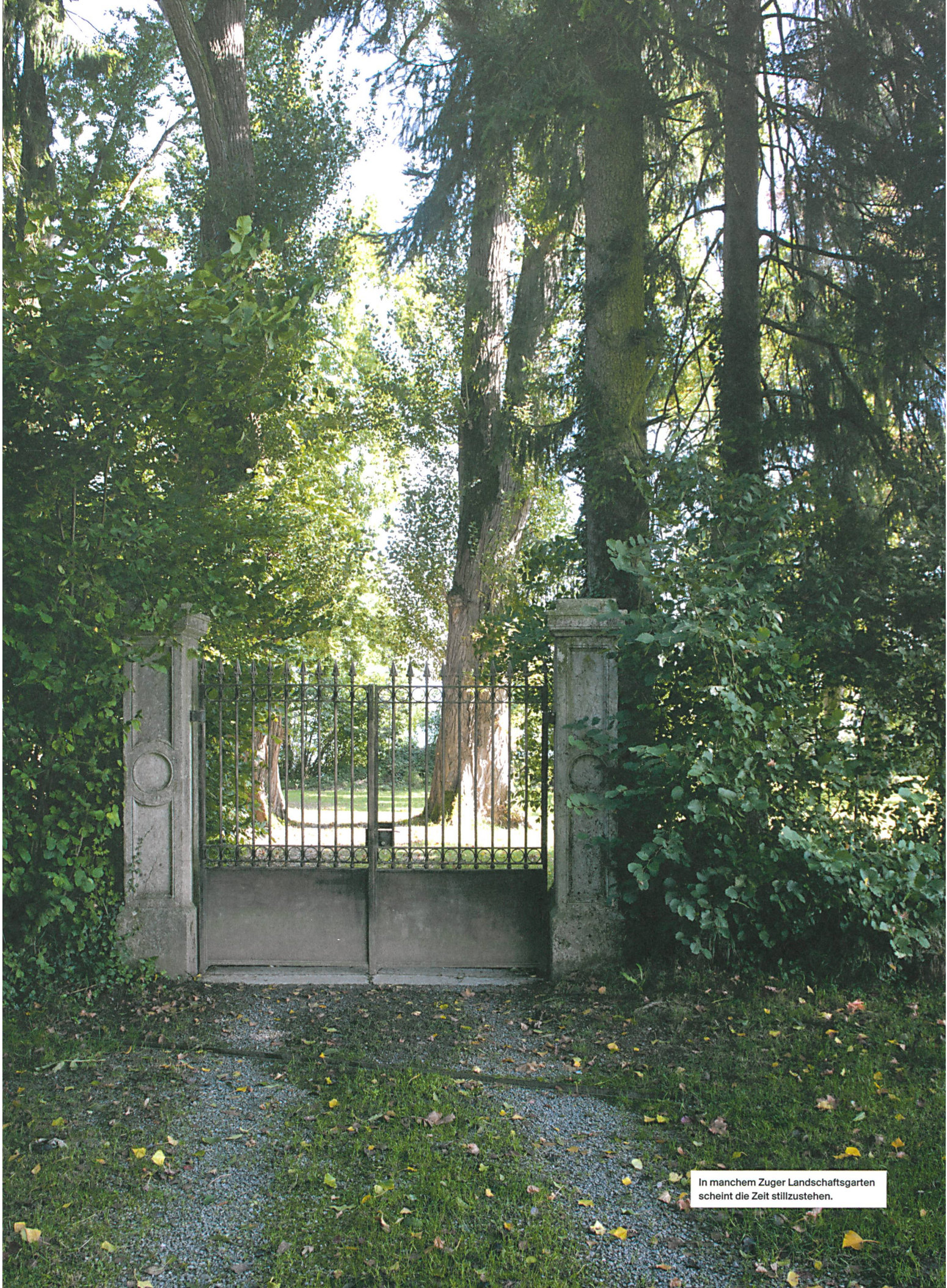
In manchem Zuger Landschaftsgarten scheint die Zeit stillzustehen.