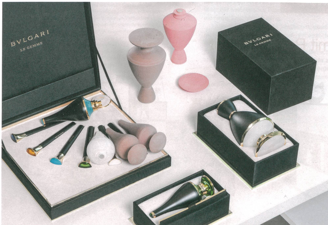
«Le Gemme» für Bulgari: Aus Volumenmodellen werden später Flakons.

Text: Lilia Glanzmann, Fotos: Anja Schori