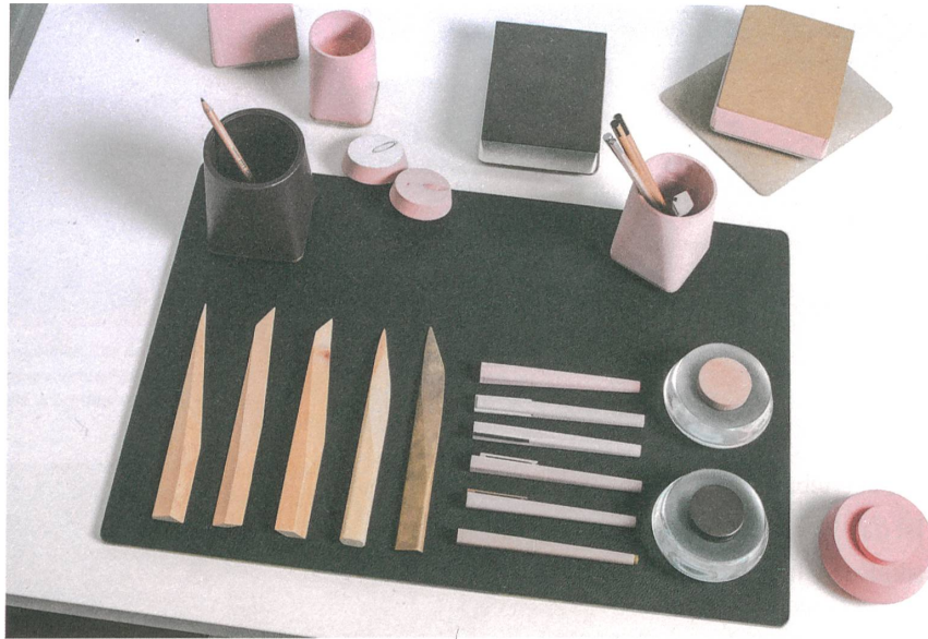
Formstudien für die Haute Couture zum Schreiben: Spitzer, Tintenfass und Brieföffner, in Zusammenarbeit mit Hieronymus-Kreativdirektor Thorsten Traber entworfen.