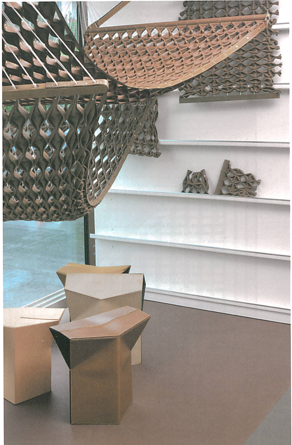
Entwurf und fertiges Produkt: Ateller O'is Hängematte und Hocker für Louis Vuitton.