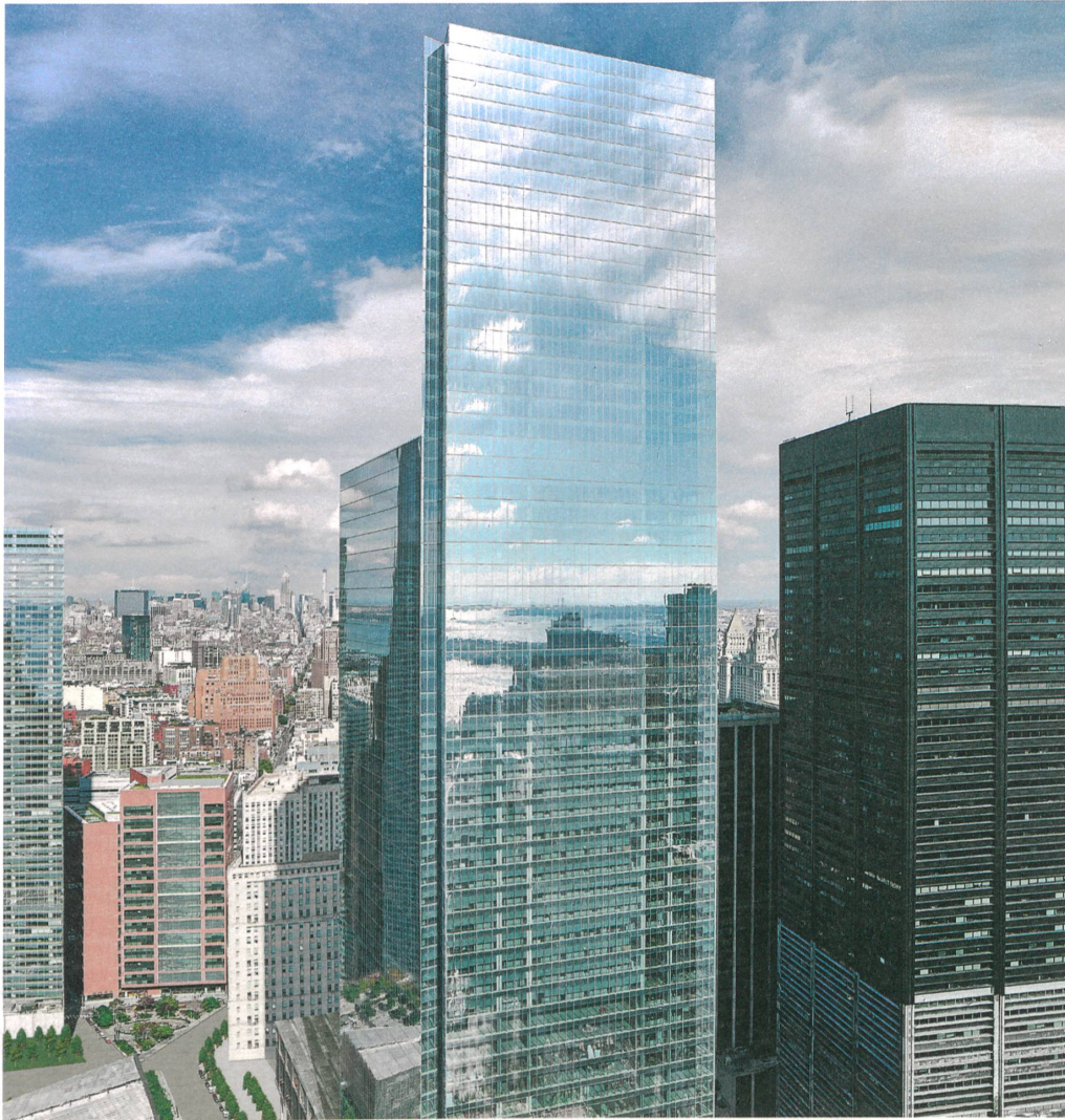
4 World Trade Center, New York