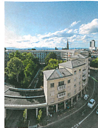
Das kreisrunde Bâtiment annulaire von Pierre-Jean Guth entstand 1955 beim Wiederaufbau des Bahnhofquartiers.