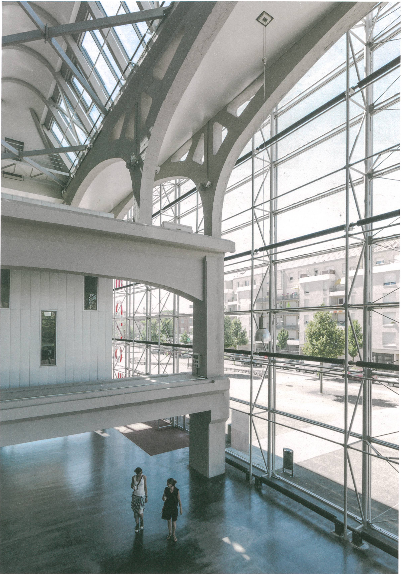
Eine 1924 erbaute Fabrikhalle auf dem Fonderie-Areal bauten Mongiello & Plisson 2007 für die Universität um; da befindet sich auch «La Kunsthalle Mulhouse».