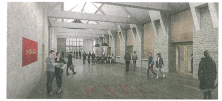
«Kilomètre zéro» will auf dem Fonderie-Areal digitale Unternehmen ansiedeln. Delemazure Architectes entwerfen die Einbauten.