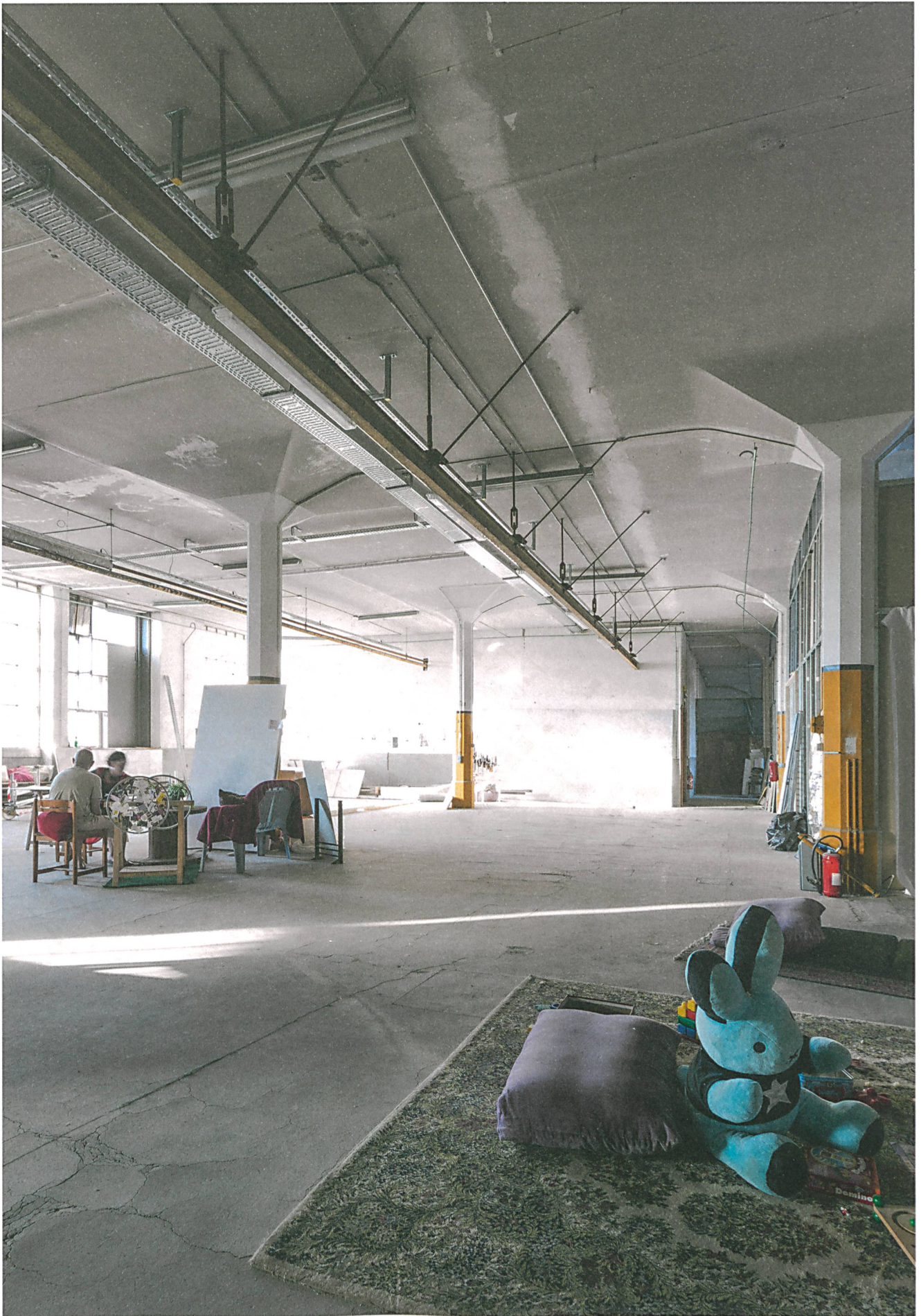
In Mulhouse ist viel Platz für Ideen: Teile des DMC-Areals sind bereits an Kreative vermietet, die sich im Verein Motoco («more to come») zusammengeschlossen haben.