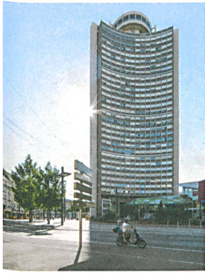
Die 100 Meter hohe Tour de l'Europe entwarf François Spoerri 1972.