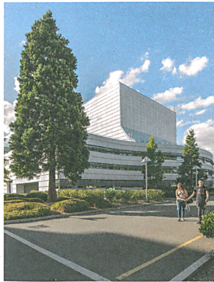
Claude Vasconi baute 1993 das mächtige Théâtre Filature.