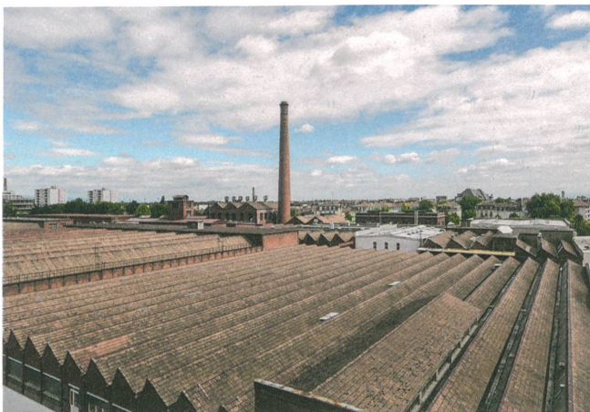
Auf dem DMC-Areal in Mulhouse reihen sich riesige Backsteinhallen.