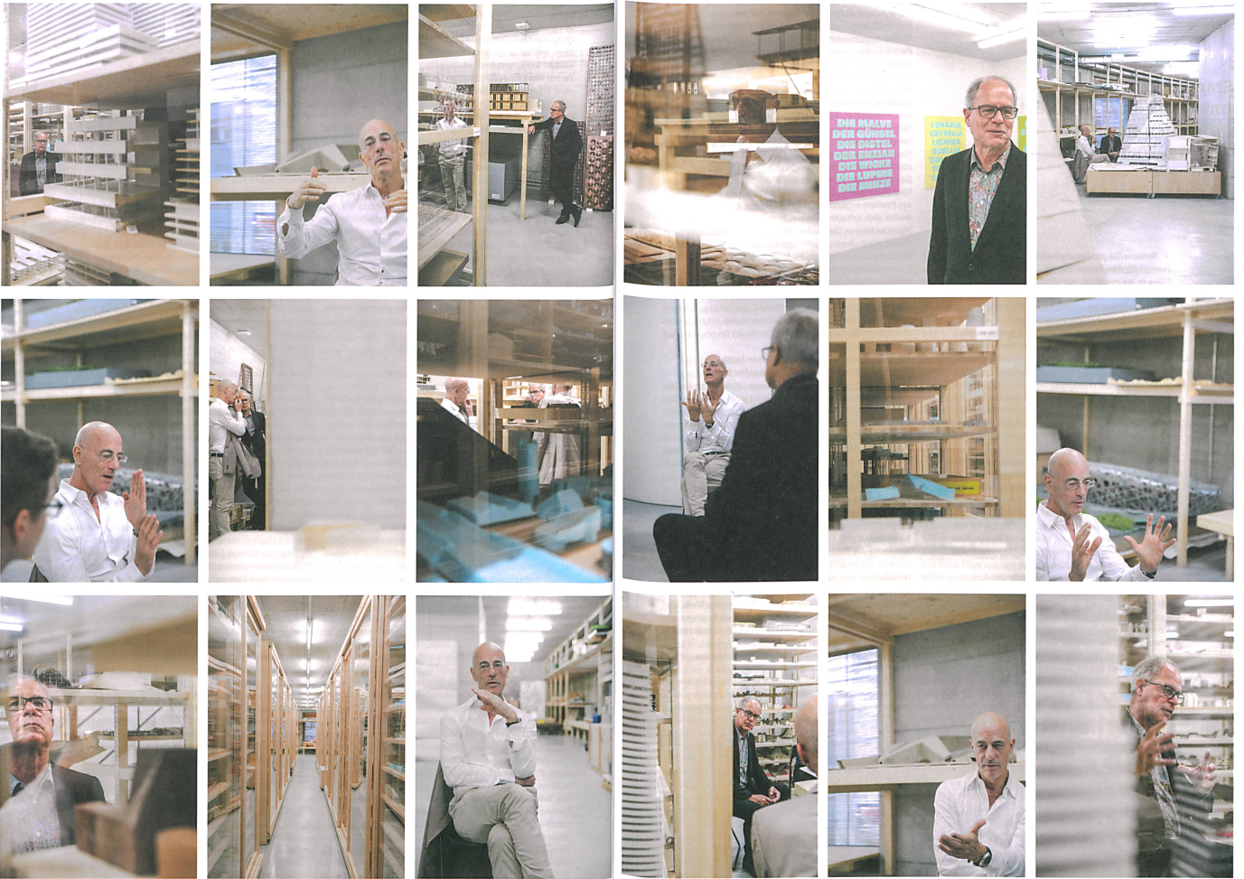
Gespräch zwischen Modellen und Epochern: Die Architekten Jacques Herzog und Pierre de Meuron in ihrem «Kabinett» auf dem Dreispitz-Areal in Basel.