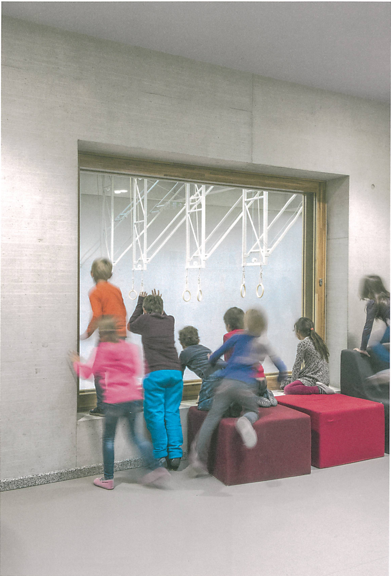
Schulhaus Zinzikon in Winterthur: Von überall her geht der Blick in die zentrale Turnhalle.