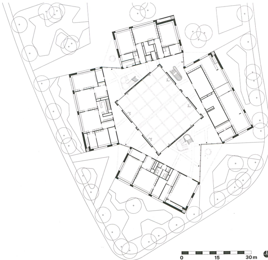
Der Erdgeschossgrundriss zeigt den Clou: in der Mitte die Turnhalle, aussen die Klassenzimmer, dazwischen die spannungsvoll geformte Eingangshalle.