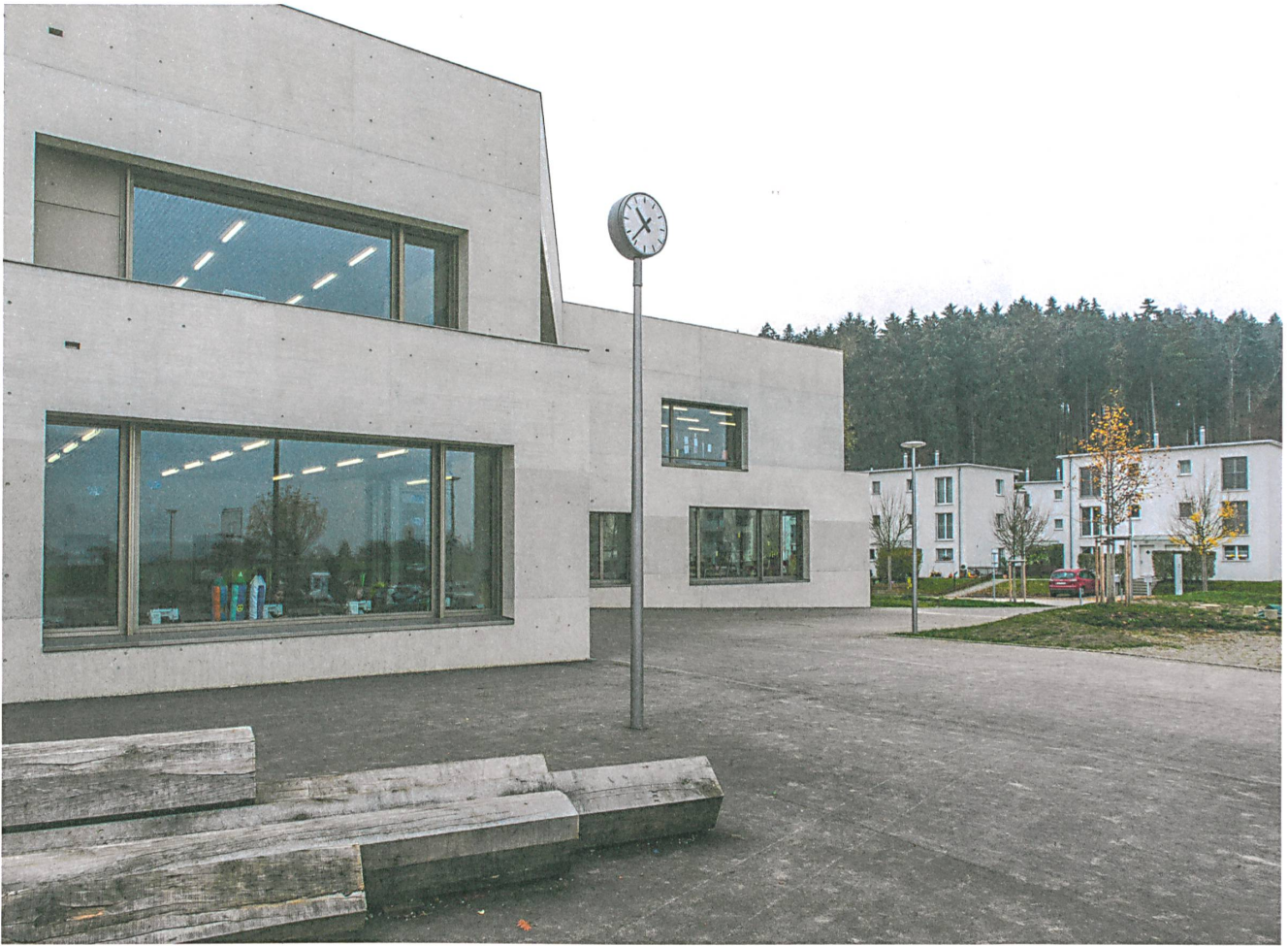
Das Schulhaus ist ein kräftiges Zentrum in der zerfransenden Vorstadt. Rücksprünge und unterschiedlich bearbeitete Betonoberflächen nehmen seine Grösse etwas zurück.

→ Klassenzimmer. In den Gruppenräumen liegt die Decke ebenfalls tiefer und holt mit trichterförmigen Oberlichtern die Sonne hinein. Die Materialien und Farben in den Räumen lassen vermuten, dass die Architekten ihre Ferien mehr als einmal in Skandinavien verbracht haben. Von dort kommt vielleicht auch die Idee, auf dem Dach ein Freiluftklassenzimmer einzurichten, das leider eingesparrt wurde. Wenn die Finanzen der Stadt wieder im Lot sind, wird es hoffentlich nachgerüstet.