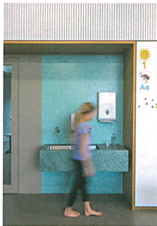
Farb- und Materialklänge in den Zimmern.