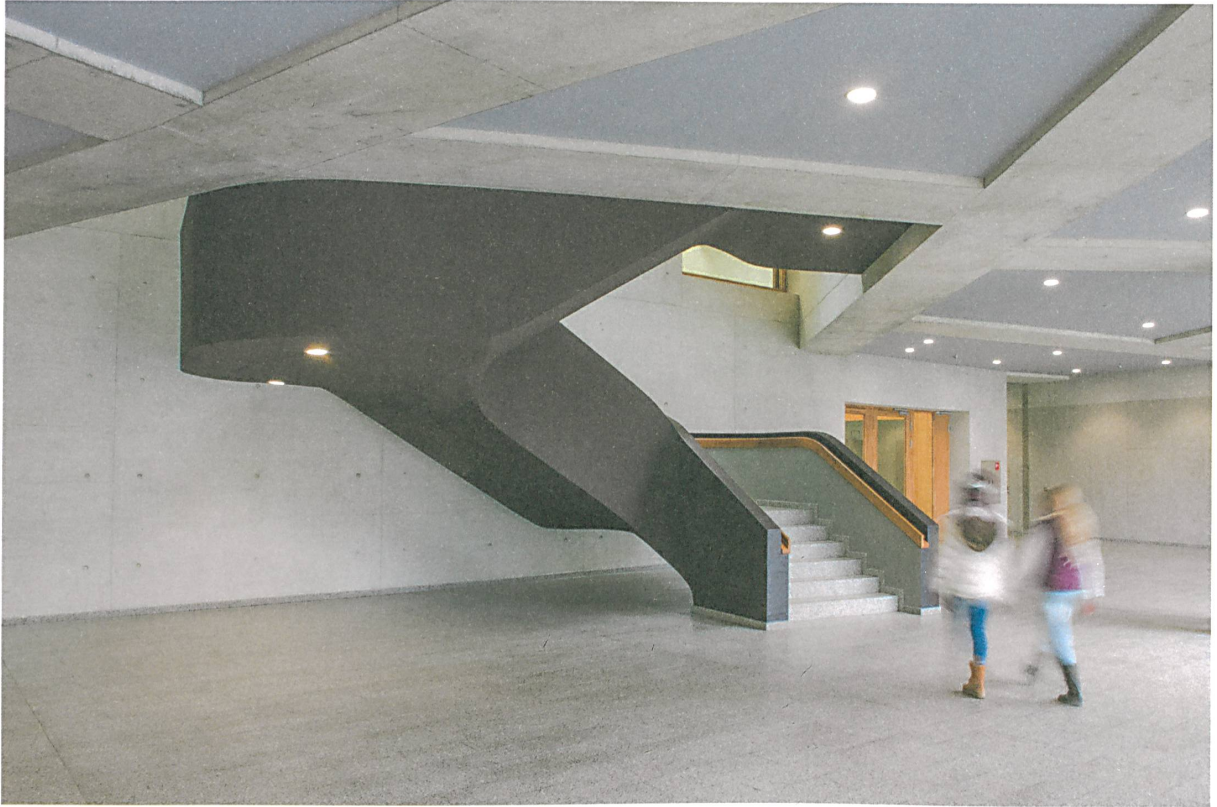
Die Eingangshalle mit kräftiger Deckenkonstruktion und schwarzem Treppenkörper.