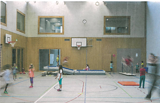
Eine Turnhalle, die auch für festlichere Veranstaltungen genutzt werden kann.