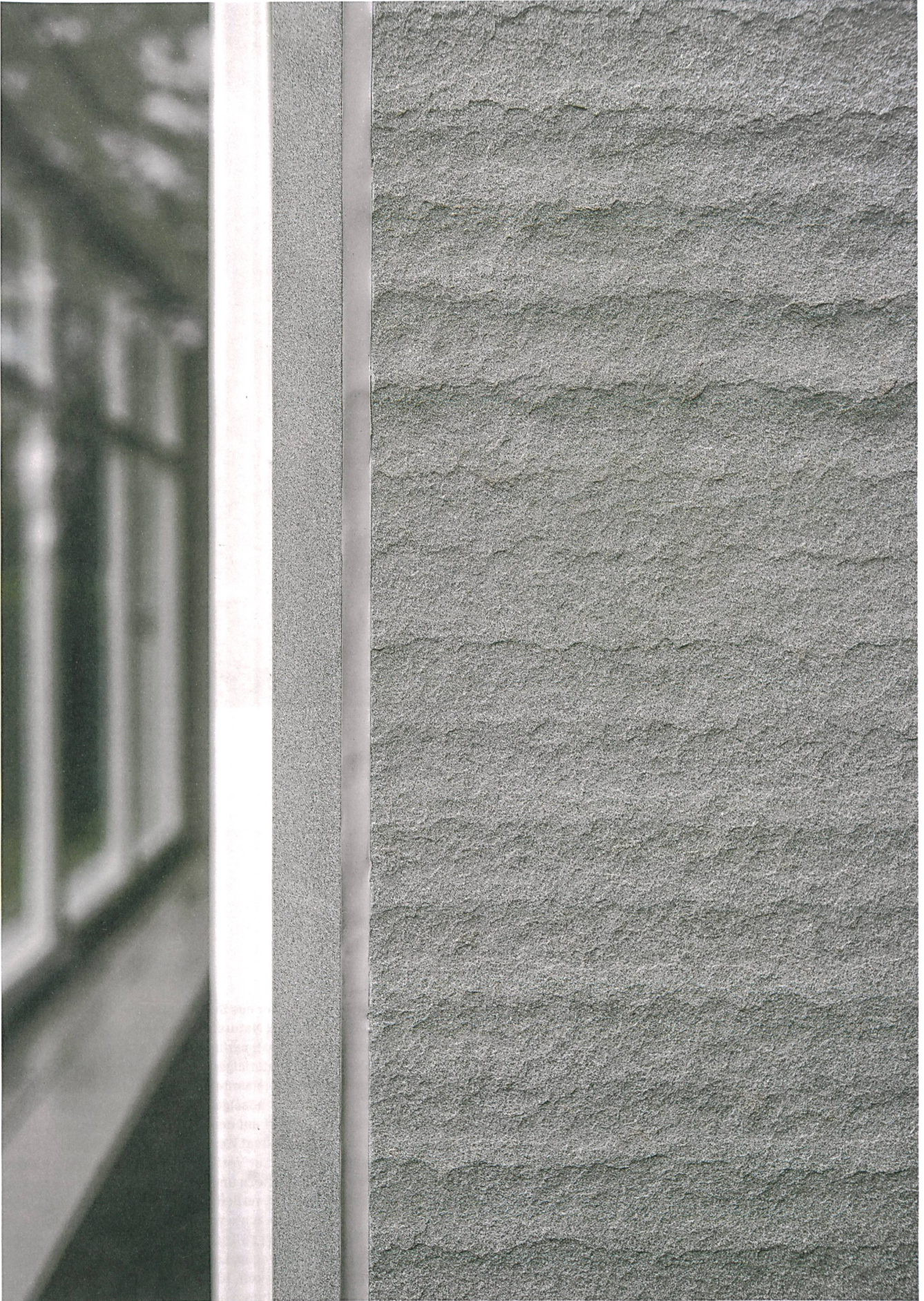
Der geflammte Rorschacher Sandstein schützt und trägt als Teil einer Verbundkonstruktion eines Anbaus in Obfelden.