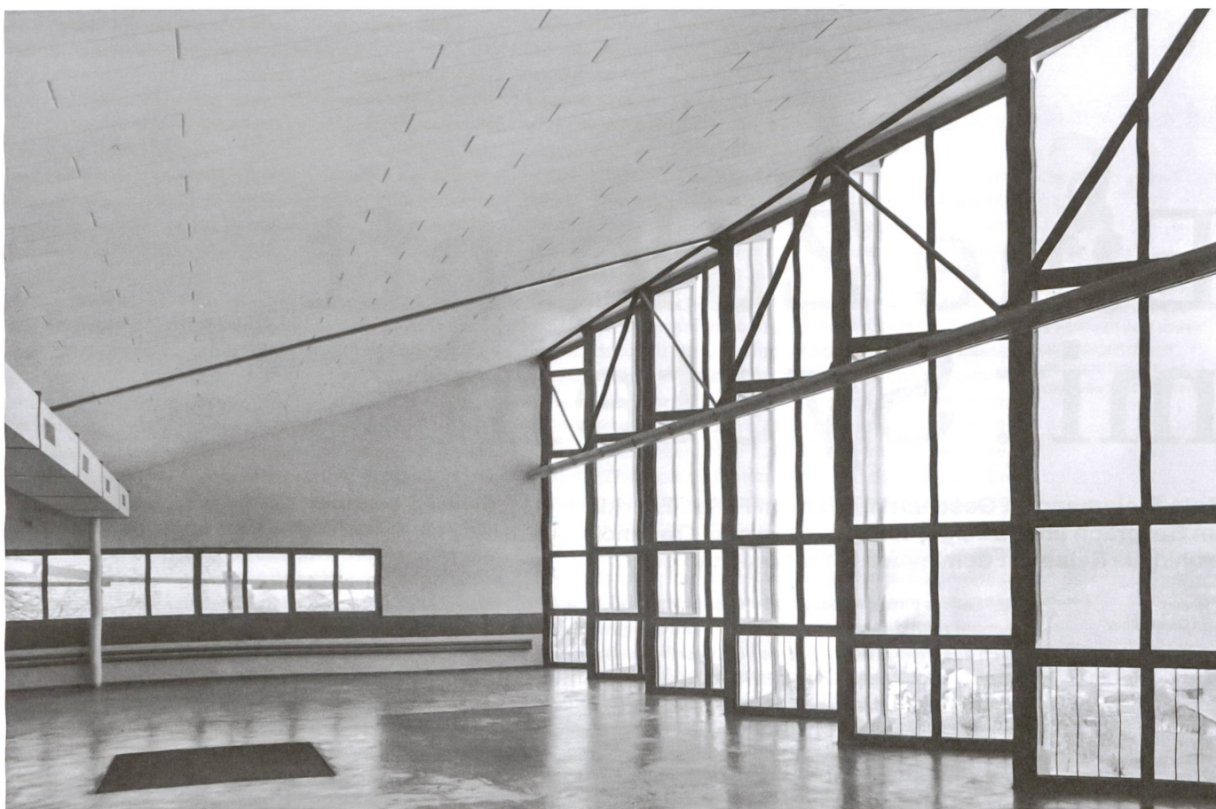
Die nach innen gefaltete Fassade bringt viel Licht in die Produktionshalle, die noch heute genutzt wird.

Bei der Dachform orientierte sich der Architekt an der klassischen Shedkonstruktion. Die Situation in Horgen liess eine Ausrichtung der Verglasung genau nach Norden jedoch nicht zu, und aus Nordosten hätte zu viel Sonnenlicht und Wärme in die Räume gestrahlt. Bloss: Die Fehler, die er bei Blattmann gemacht hatte, wollte er nicht wiederholen. Die Lösung fand Fischli mit der Zickzackform, mit der er die nach Nordosten gerichtete Glasfläche in nord- und ostwärts gerichtete Abschnitte faltete. Die nach Norden ausgerichteten Flächen füllte er mit Klarglas, die nach Osten gerichteten Bereiche erhielten eine lichtstreuende, sonnenlichtreflektierende Thermolux-Verglasung. Hätte Fischli die Zickzackfenster auf das Sheddach beschränkt, hätte der Bau nicht die kraftvolle Präsenz erhalten. Diese erhielt er nur, weil der Architekt das talseitige Oberlicht gleich auch zur Fassade machte. Dort fügte er auf Augenhöhe ausserdem einen Streifen mit Klarglas ein. Diese Fenster hätten eine «rein menschliche Funktion». Fischli: «Sie verhindern, dass bei den Arbeitenden das Gefühl des Eingesperrtseins aufkommt.»