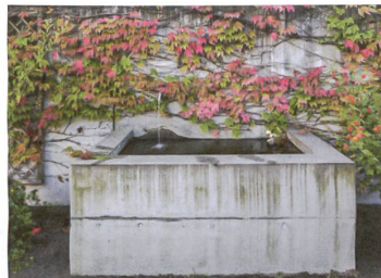
Im Zentrum der Brunnen.

Zeilen findet sich ein Grünstreifen mit Sitzplätzen, die den Wohnungen zugeordnet sind. Diese architektonische Setzung bestand bereits, als Fahrni und Breitenfeld Landschaftsarchitekten aus Basel für die Gestaltung des Aussenraums beigezogen wurden.