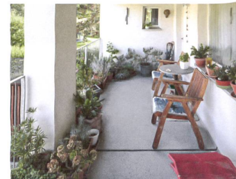
Der Laubengang, ein wohnlicher Ort.