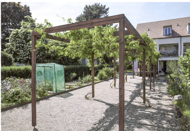
Vielfältige Nutzungsmöglichkeiten im klaren Raster.

Die Siedlung, die sich in die kleinteilige Umgebung einfügt, besteht aus zwei parallel angeordneten, zweistöckigen Gebäudezeilen mit ausgebautem Dachgeschoss. Die Riegel sind spiegelbildlich in den geräumigen Innenhof orientiert. Zusammen mit den breiten, wohnlich eingerichteten Laubengängen, die über einen Lift bequem auch in die oberen Wohnungen führen, begünstigen sie tägliche Kontakte und zufällige Begegnungen. Ist in einer der Wohnungen der Rollladen einmal nicht hochgezogen, wird nachgeschaut. An den äusseren Flanken der beiden