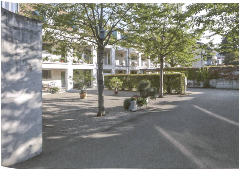
Der Kiesplatz wird als Autoabstellplatz nicht gebraucht und erlaubt andere Nutzungen.