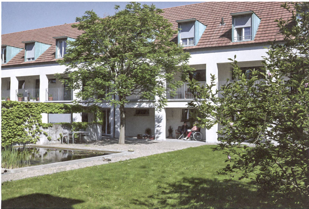
Die Wohngenossenschaft Pestalozzi in Muttenz hat differenzierte Übergänge von privaten zu halböffentlichen Bereichen.