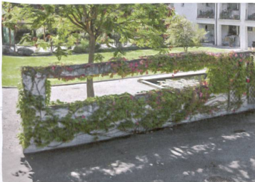
Pflanzen überspielen die harten Konturen der Architektur.