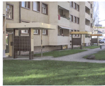
Nüchterne Hauseingänge auf der Strassenseite.