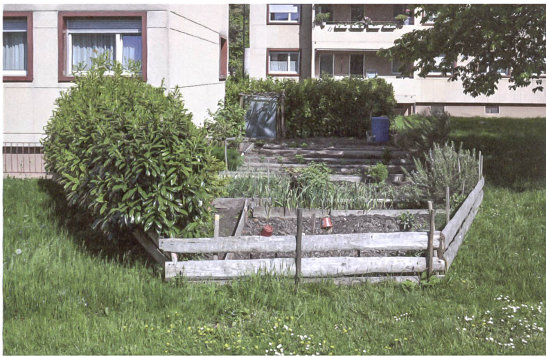
Lebensdienliche Italianità in Schwamendingen.