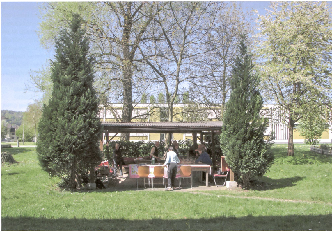
Der viel frequentierte, selbst gebaute Gartenpavillon, würdig gerahmt.