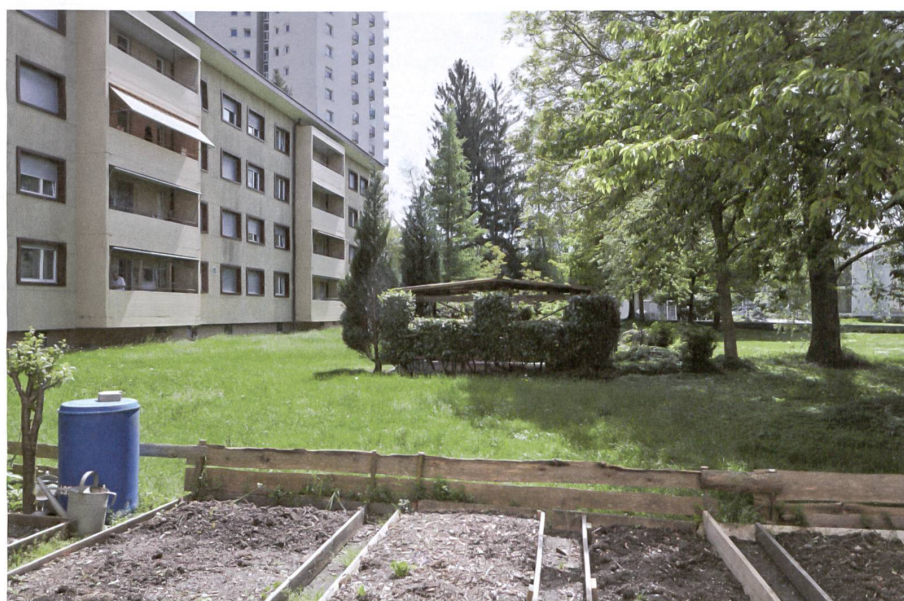
Bewohnerinnen und Bewohner haben sich vor über dreissig Jahren den Grünraum angeeignet.