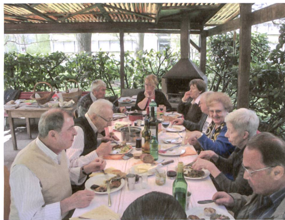
Zum spontan organisierten Essen bringt jeder mit, was er gerade hat.