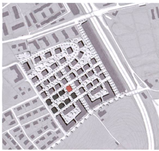
Das Haus 29 im Neubauquartier «Schönberg-Ost» am Ostrand von Bern.