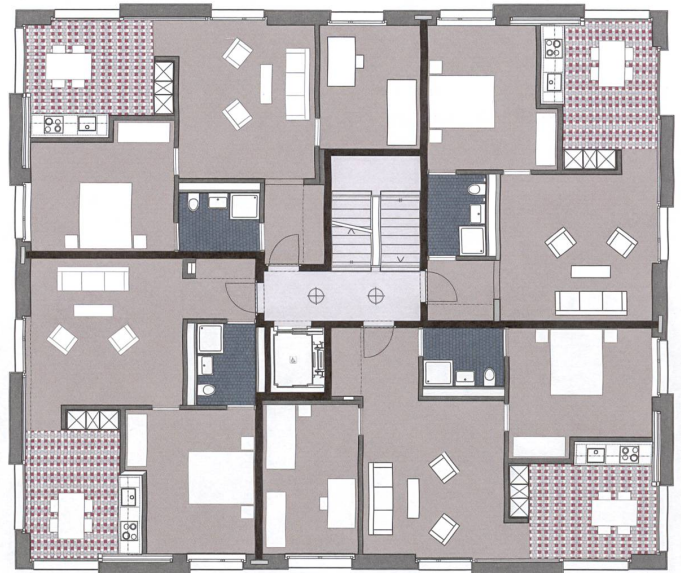
Grundriss Regelgeschoss: Die gefliesten Bäder und Küchen wirken wie Intarsien in der ansonsten rohen Materialisierung.