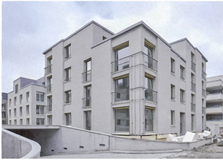
Grauer Kratzputz, gelbe Markisen und plastische Feinheiten prägen das schlichte Äussere.