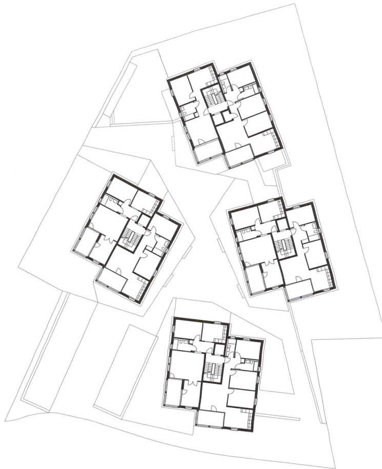
Grundriss Regelgeschoss und Umgebungsplan mit der Piazzetta im Zentrum der Neubauten.