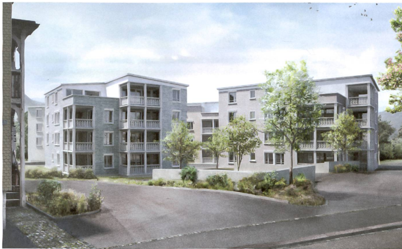
Die Überbauung besteht aus einem Ensemble von vier ähnlichen Wohnhäusern.

von Deon Architekten, Luzern, reagiert mit vier plastisch geformten Baukörpern besonders gut auf die Körnigkeit der Bebauung in der Umgebung. Eine Sequenz von Plätzen mit unterschiedlicher Stimmung verbindet die bestehenden Wege, leitet die Fussgänger bis zur Kirche und wird der zentralen Lage im Dorf gerecht. Der grosszügige Zugangplatz, auf dem, wie bei historischen Stadt- oder Dorfkernen, die Besucherparkplätze unter Baumkronen angeordnet sind, öffnet sich zur Wassergasse. Ein bemerkenswerter Aspekt ergibt sich durch Einschnitte in die Dachflächen. Diese wurden nötig, um die erlaubte bauliche Dichte einzuhalten. Die so entstehenden Dachterrassen sind nicht etwa exklusiven Penthouses zugeordnet, sondern je zwei kleinen Wohnungen.