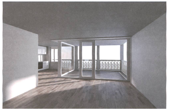
In den grossen Wohnungen sind Küche und Wohnzimmer nach Süden und zum Balkon gerichtet.