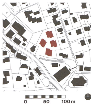
Die vier Häuser entstehen im Dorfkern nahe der Kirche, unten rechts.