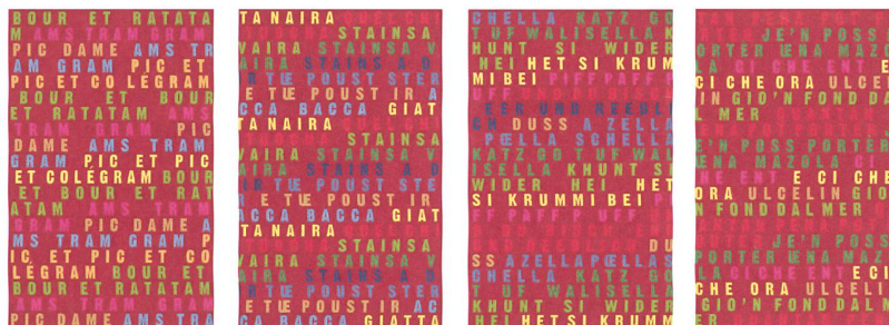
Farbentwurf des «allover» für die vier Säulen im Foyer des Quaderschulhauses in Chur mit Abzählreimen in je einem Dialekt der vier Sprachregionen der Schweiz.