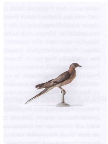
«George – columba migranta» von Mirko Baseligia.