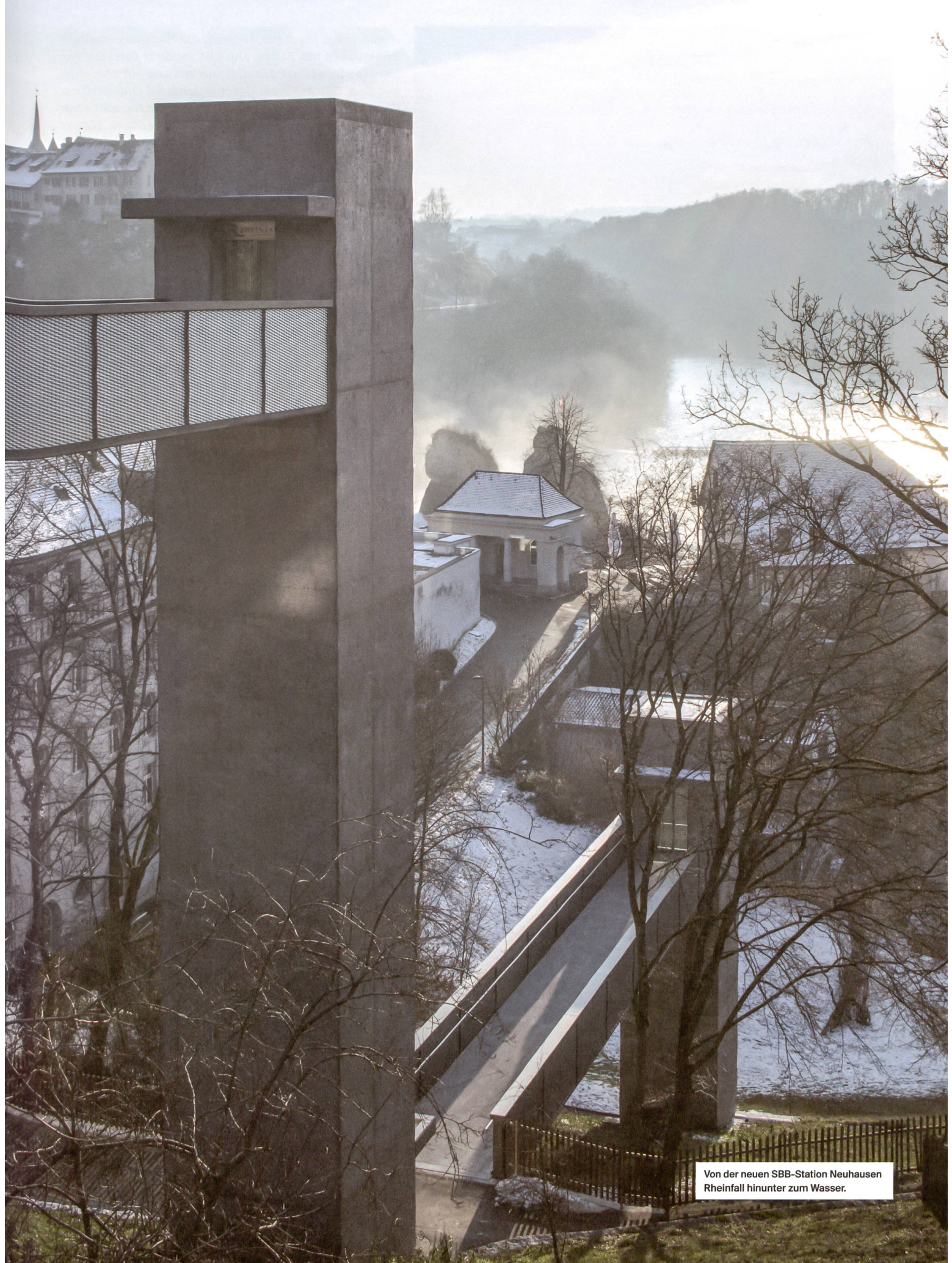
Von der neuen SBB-Station Neuhausen Rheinfall hinunter zum Wasser.