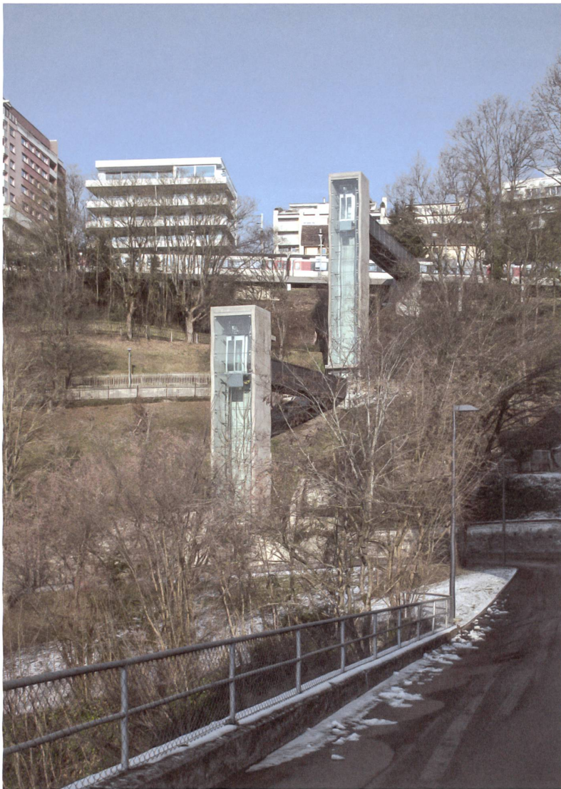
Viel mussten die Liftbauer berücksichtigen: Landschaftsbild, Schlingnattern und Baumbestand.

SBB-Haltestelle Neuhausen Rheinfal, 2015 Bauherrschaft: SBB Infrastruktur Region Ost und Koordinationsstelle Öffentlicher Verkehr, Kanton Schaffhausen Federführung und Bauleitung: Wüst Rellstab Schmid Bauingenieure, Schaffhausen Architektur und Landschaftsarchitektur: SBB in Zusammenarbeit mit Planikum, Landschafts- architektur und Umwelt- planung, Zürich Liftplaner: Hansruedi Wehrle, Schachen b. Herisau Schlosserarbeiten: Bachofer, Arbon Auftragsart: Direktauftrag Gesamtkosten (Lifтанlagen und Stege): Fr. 2 Mio. Lifte: EMCH Aufzüge AG, Bern