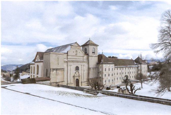
Im stumpfen Nordturm der Abteikirche von Bellelay verbirgt sich ein neuer Lift.