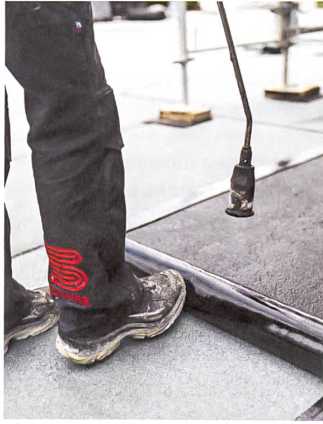
Ein Mitarbeiter verschweisst auf einem Flachdach Bitumenbahnen.