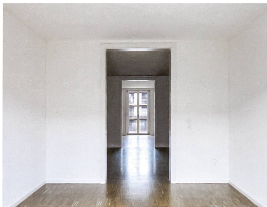
Eine Enfilade ermöglicht den Durchblick durch die ganze Wohnung.