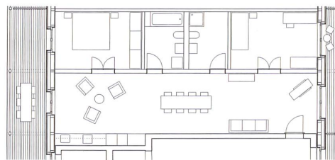
C 3 1/2-Zimmer-Wohnung