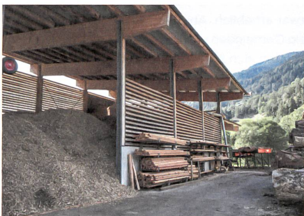
Holzsnitzellager für den Wärmeverbund Ernen.