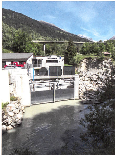
Saniertes Kleinwasserkraftwerk am Wysswasser in Fiesch.