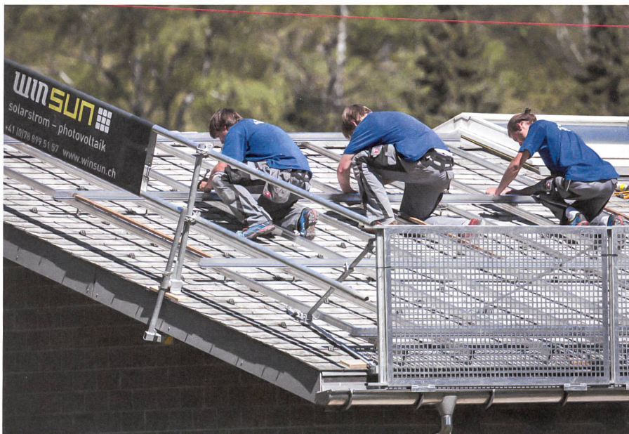
Drei von inzwischen mehr als vierzig Winsun-Angestellten montieren Solarpanels auf einem Walliser Hausdach.

Christa Mutter, Fotos: Dominic Steinmann