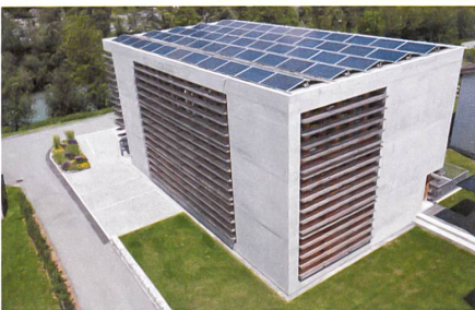
Das Bürohaus Cavigelli in Ilanz produziert mehr als doppelt so viel Energie, als es braucht. Projekt: Vincenz Weishaupt Architekten