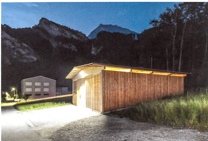
Das Holzkraftwerk von Fläsch. Architektur: Norbert Mathis

Wir können rheinauf- und -abwärts weiterreisen zu Dutzenden Beispielen. Doch jeder Pionier, jeder Bauherr, jede Gemeinde werkelt vor sich hin. Trotz Dorf- und Einzeldenken ist die Summe zwar erheblich. Aber noch besser wäre, die siebzug Gemeinden von Tamins bis an den Bodensee würden sich zur Energistadt Alpenrhein zusammenschliessen, um sich autark aus Erneuerbaren zu versorgen. Diese Stadt zu gründen, wird ein Vorhaben der heute Zehn- und Zwanzigjährigen. Atomstrom wird ihnen ein Fremdwort sein – auch wenn sie für den Abbruch der AKWs noch kräftig werden zahlen müssen. Köbi Gantenbein