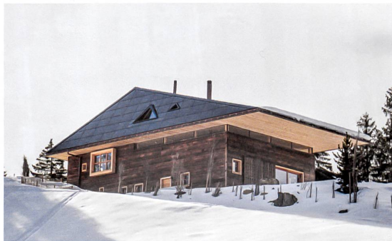
Für das Wohnhaus Sieber in Sörenberg produziert die Sonne viermal mehr Energie, als das Haus braucht. Projekt: Scheitlin Syfrig Architekten