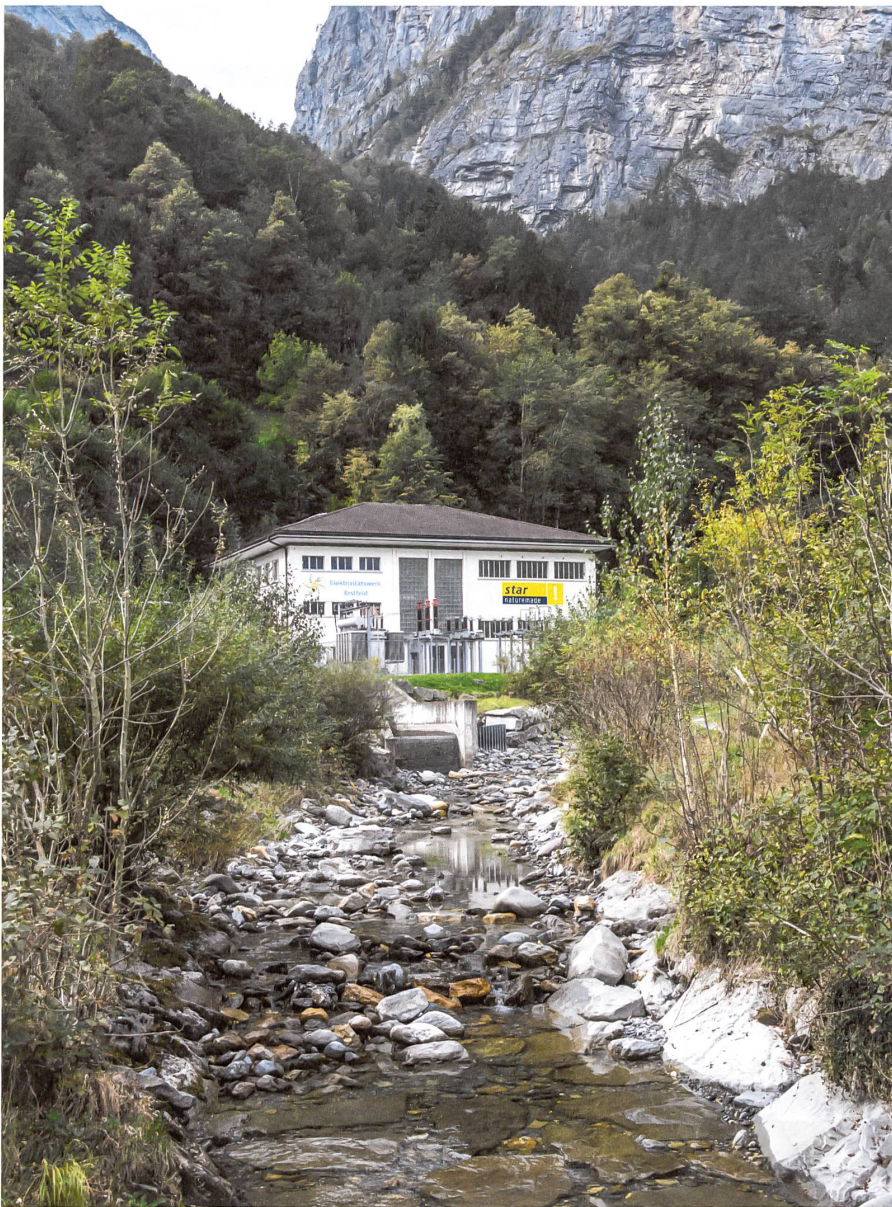
Die Turbinen in der Zentrale Ripshausen der Gemeindewerke Erstfeld liefern übers Jahr gerechnet mehr Strom, als die «Energistadt» selbst verbraucht.