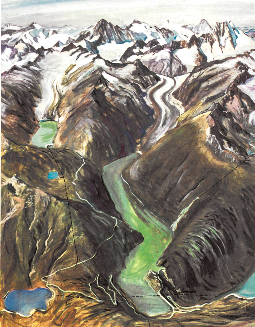
Der Grimselsee, wie ihn G. P. Luck in «Wilde Wasser, starke Mauern» malte. Das Silva-Buch von 1962 ist ein Heldenbuch der Schweiz.