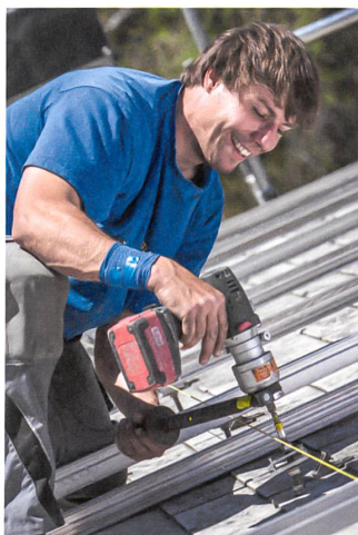
Solaranlagen werden meist von A bis Z selbst aufgebaut.