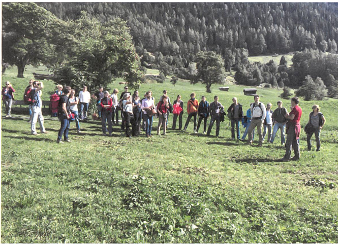
Energieexkursionen im Goms werden immer beliebter.