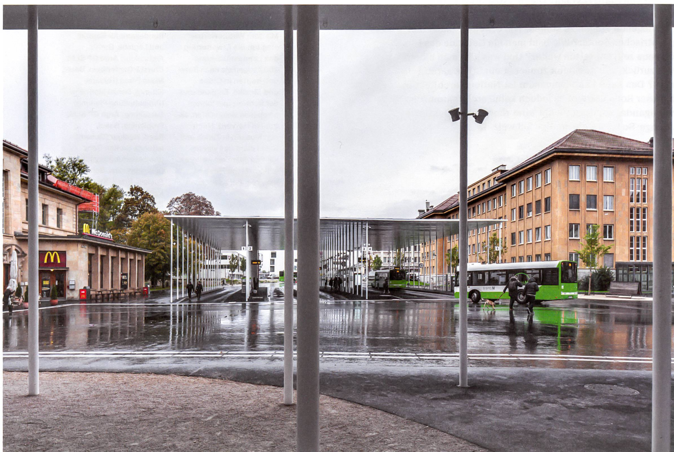
Zwei weisse Dächer ordnen den Bahnhofplatz von La Chaux-de-Fonds neu. Das grössere von beiden schützt die Wartenden im Busbahnhof.

Der Wind pfeift durch die schachbrettartig angelegten Strassen von La Chaux-de-Fonds. Weit ist die Place de la Gare, ihre Häuser sind steingelb und behäbig. Zwei grosse neue Dächer strahlen weiss über dem Platz. Sie drehen sich leicht aus der Richtung, der alle Gebäude folgen. Die Dächer setzen dem Vorhandenen etwas entgegen, dem Wetter und dem Gelb, dem Raster und dem Behäbigen. Trat man früher aus dem Bahnhof, blickte man auf eine →