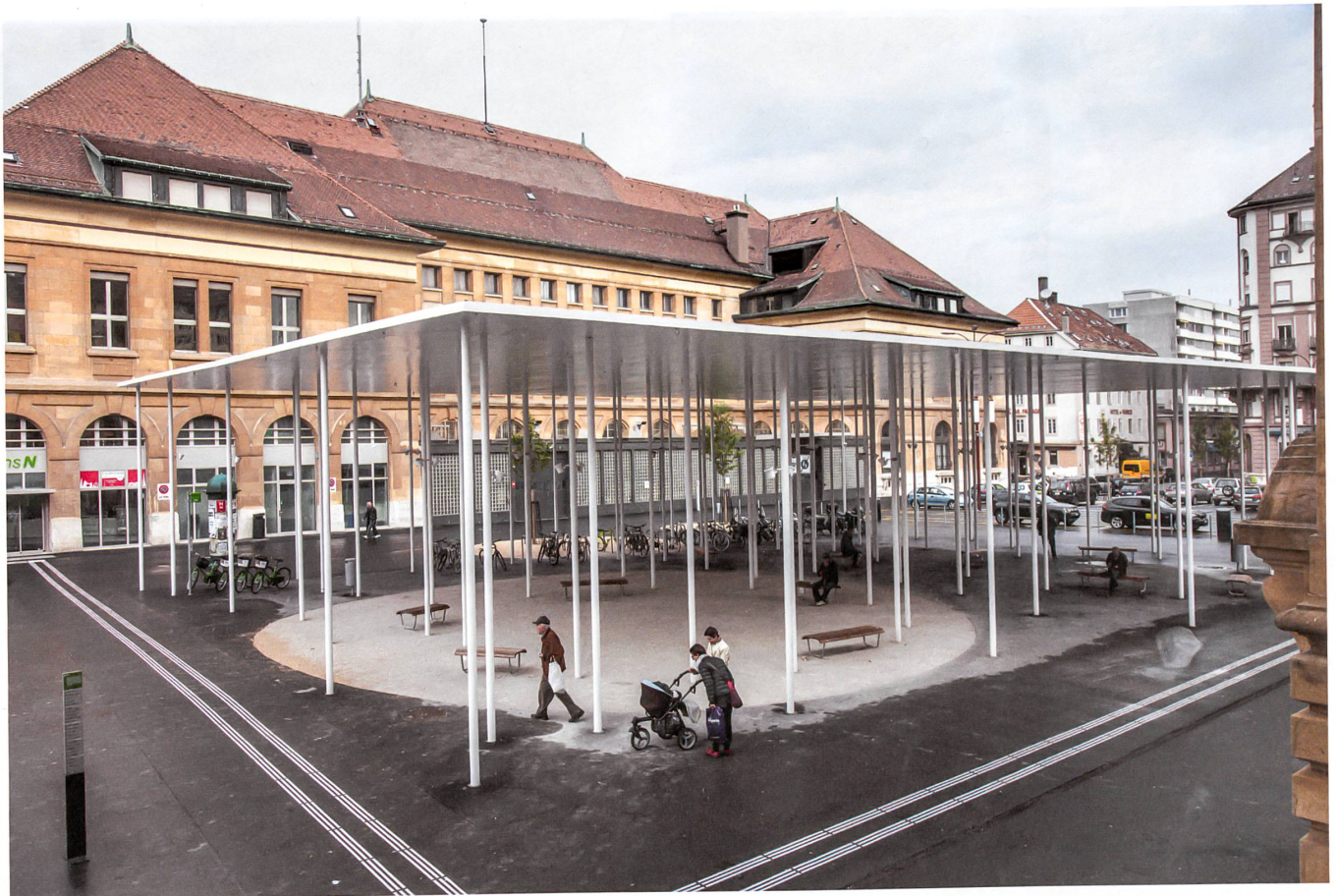
Das kleinere Dach ist den Fussgängern vorbehalten, die darunter auf zwölf Bänken ausruhen können.