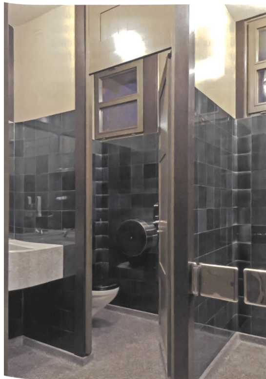
Ladner Meier Architekten machen aus dem Profanen Poesie: Züri-WC am Bürkliplatz.

Raumakustik ist ein leidiges Thema in Bars. Vorhänge hätten etwas gebracht, aber in dieser Brasserie «al stile Milano» sucht man sie nicht. Eine Geste für ältere Besucherinnen und Besucher wäre es, die Lichtmenge auf den Tischen zu erhöhen. Wenige ausgewählte Accessoires beleben den Raum. Der gestalterische Rahmen fasst das Spektakulärste des leicht überblickbaren, hohen Raums: den Ausblick aus den Fenstern, die sich über die Länge der Fassade ziehen. Die perfekte Lage im Layout tut ein Übriges dazu, dass ich mich hier wohlfühle. Für den Blick aus dieser grossstädtischen Gasthöhle dürfte einzig die Strasse belebter sein.» Stefan Zwicky, Architekt BSA/SIA, Zürich →