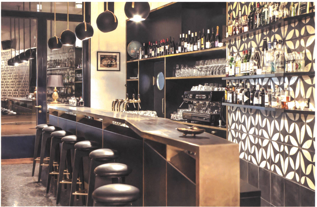
Wo man sich behaglich fühlt: im «Salon» in Zürich-Wiedikon, einer Brasserie und Bar, konzipiert von Loeliger Strub Architektur, Zürich.