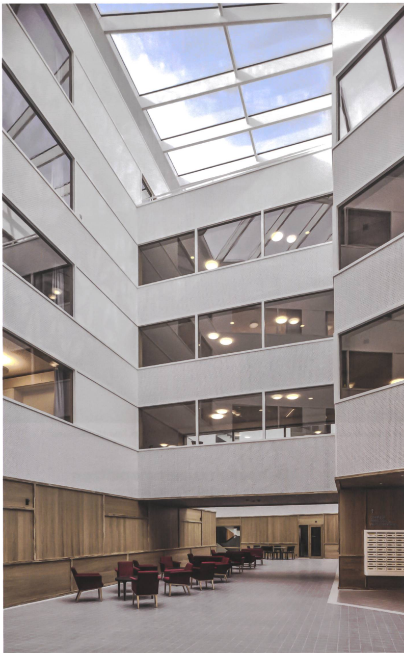
Beim Alterszentrum Obere Mühle in Lenzburg definieren Oliv Brunner Volk Architekten den Innenraum zugleich als Aussenraum.