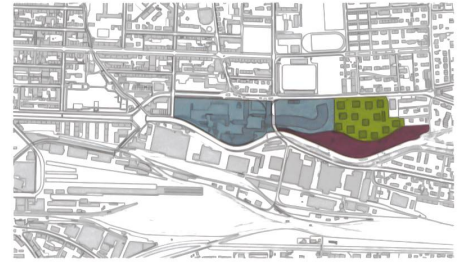
Die Stadt verkauft Gygax-West an Omega / Swatch. Shigeru Ban baut zurzeit den Riesenschwammfortsatz. Previs baut 'Jardin du Paradis'.

Die Schüss ist ein williger Fluss. Sie kommt aus dem Jura und hat die erste Industrialisierung Biels angetrieben, Stichwort Taubenlochschlucht. Dort entstanden der Drahtzug, die Protoindustrie und später die Baumwollspinnerei und -färberei weiter flussabwärts. Die Schüss ist aber auch ein rebellischer Fluss. Ihr Hochwasser überschwemmte und vernichtete. Darum musste man die Schüss erziehen. Man sperrte sie zwischen zwei Ufermauern ein. So floss sie seit 1830 dahin, diszipliniert und domestiziert. Fische gab es darin keine mehr.