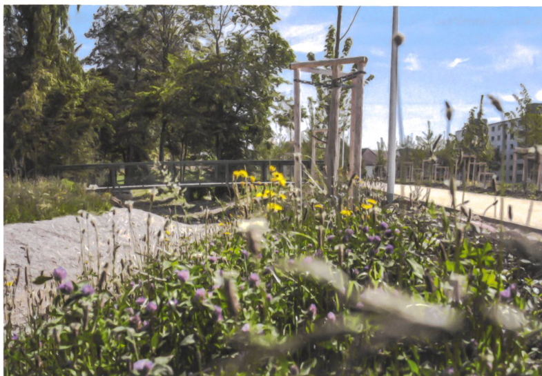
Der Hauptweg verläuft auf der Dammkrone, die Nebenwege darf ein Hochwasser fluten.