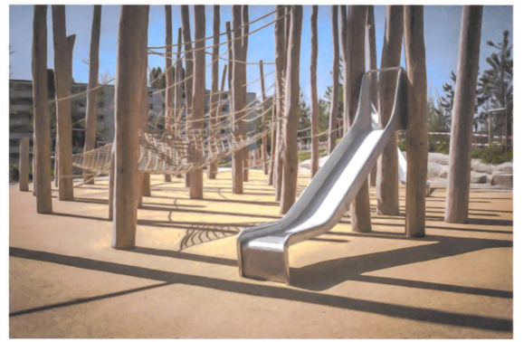
Das Ostende der Insel gehört den Kindern und ihrem lärmigen Frohbetrieb.