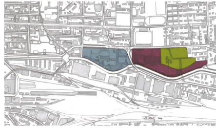
Previs kauft Gygax-West und tauscht dann mit der Stadt Ost gegen West. Die Stadt trennt die Schüssinsel ab und verwirklicht den Park.