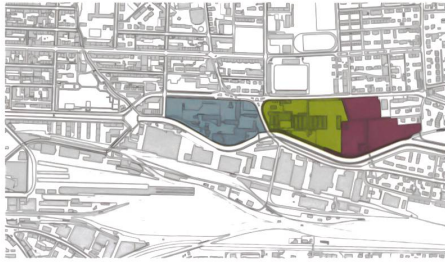
Die Ausgangslage vor der grossen Rochade: ■ Omega / Swatch, ■ Gygax-West (gehört den Erben der Gärtnerei), ■ Gygax-Ost (Besitz der Stadt Biel).