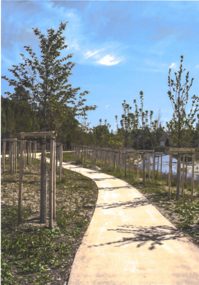
Die Schüssinsel ist eine Spazierinsel. Zwischen 600 jungen Bäumen flanieren man den Fluss hinauf und hinunter.