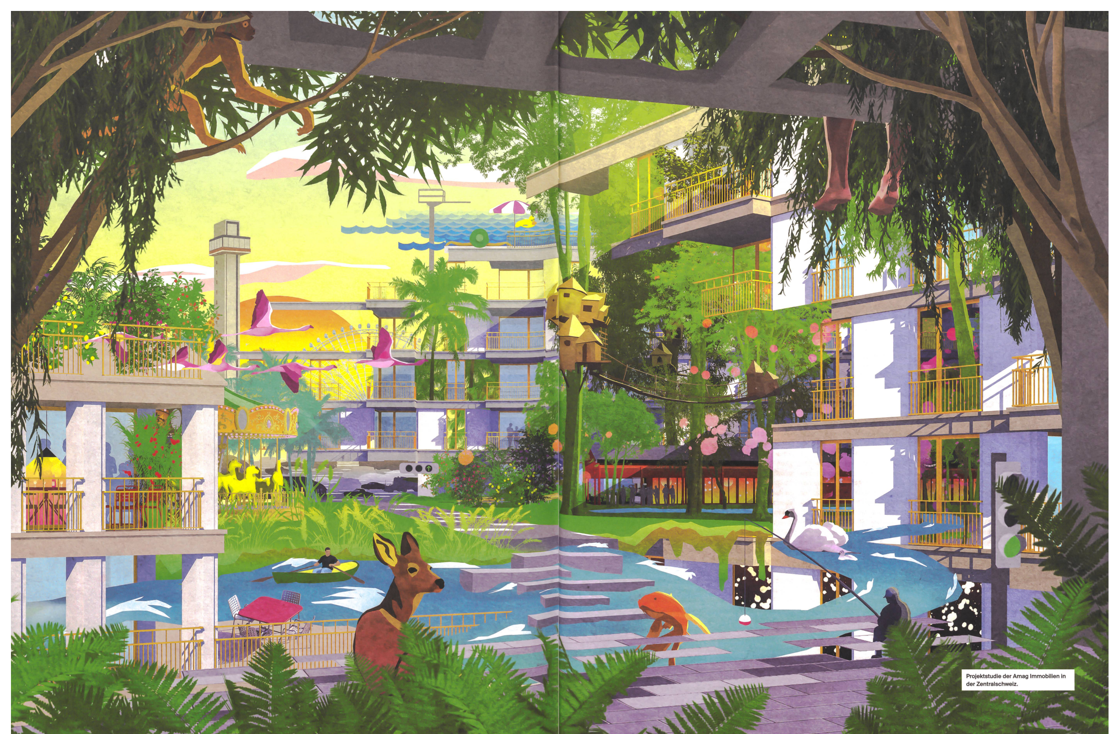
Projektstudie der Amag Immobilien in der Zentralschweiz.