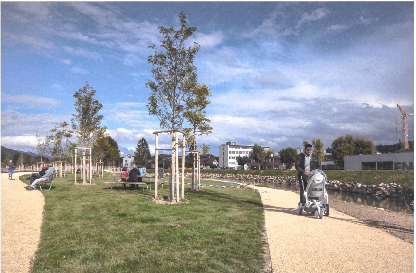
Verschiedene Wege laden zum Flanieren und Ausruhen ein. | Différents chemins invitent à la flânerie et au repos.

Die Hauptverbindung ist der Weg, der auf der Krete die Insel auf der gesamten Länge durchquert. Kleinere, mäandrierende Wege zweigen von der Hauptroute ab und schmiegen sich wieder an. Das eine Ufer der Insel folgt dem ehemaligen Schüsskanal, der nun aufgebrochen und renaturiert ist. Auf der anderen Seite der Insel fließt - je nach Wasserstand - der schmale Steblerkanal, der stellenweise bereits existierte und den man nun verlängert hat.