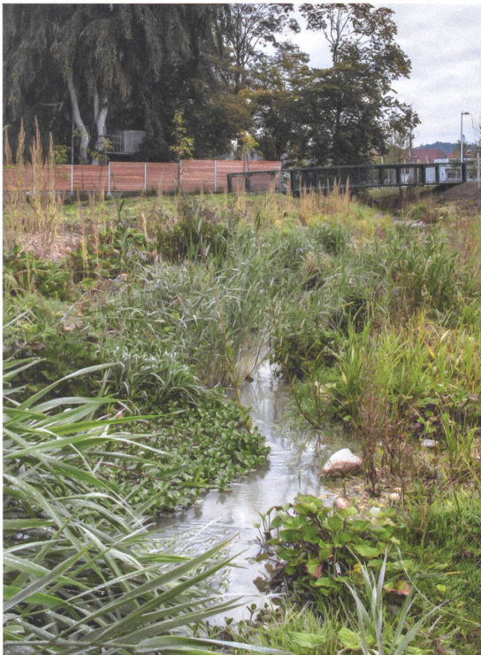
Die Verlängerung des Steblerkanals ist naturnah gestaltet. | L'aménagement du canal Stebler prolongé est proche de l'état naturel.