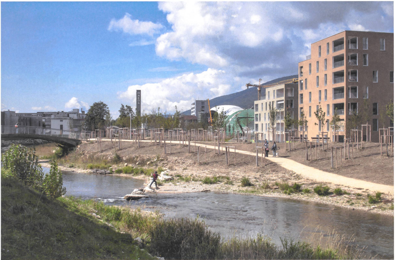
Am Ufer der Schüss wird ein Wald wachsen. | Un bosquet voit le jour au bord de la Suze.