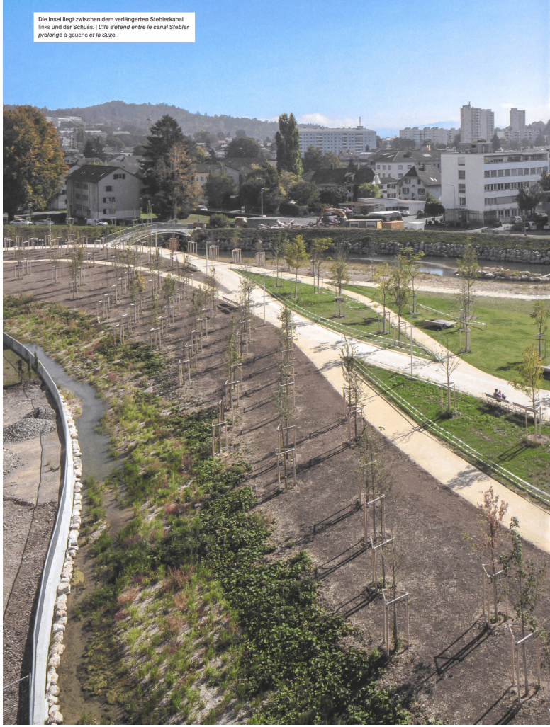
Die Insel liegt zwischen dem verlängerten Steblerkanal links und der Schöss. L'île s'étend entre le canal Stebler prolongé à gauche et la Suzs.