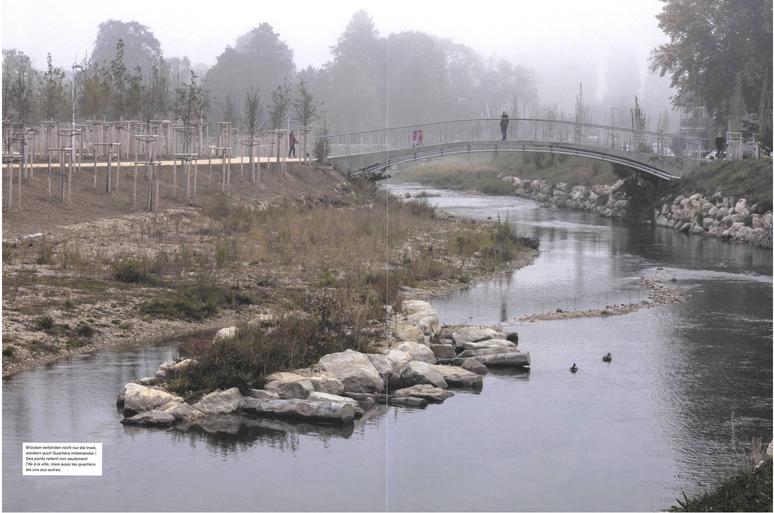
Brücken verbinden nicht nur die Insel, sondern auch Quartiere miteinander. | Des ponts relient non seulement l'île à la ville, mais aussi les quartiers les uns aux autres.