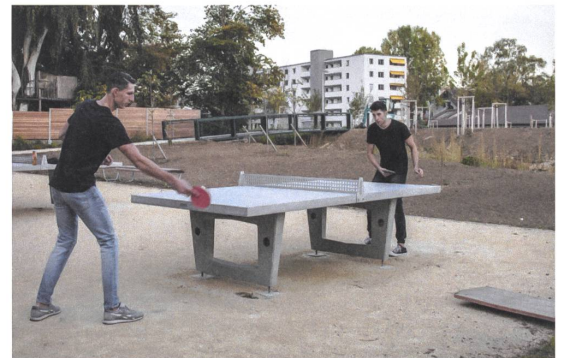
Breites Freizeitangebot auf der Insel. | L'île offre une large palette d'activités de loisirs.