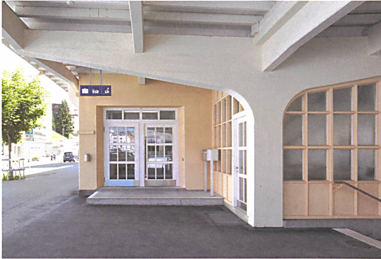
...dem Bahnhof Davos Platz die richtige Farbe wiedergeben...