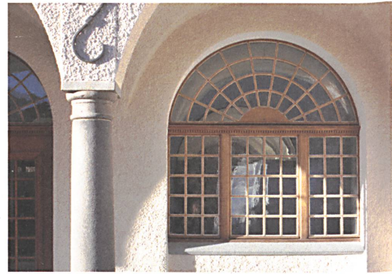
Baukultur heisst dem Detail Sorge tragen: Alte Fenster im Bahnhof Scuol reparieren...