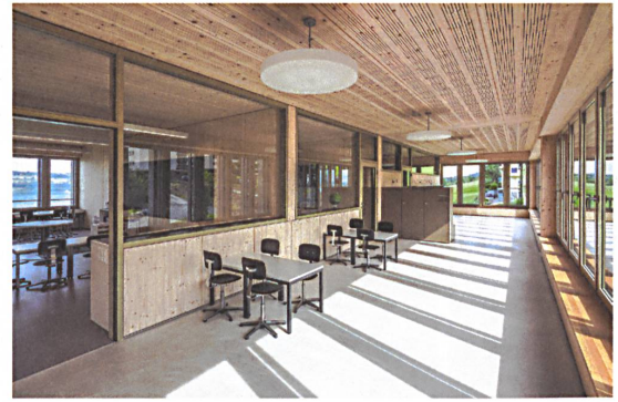
27 Im grosszügigen Korridor ist Platz für die Gruppenarbeit.