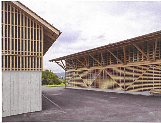
29 Eine offene Schalung aus Weisstanne verkleidet die Fassade.