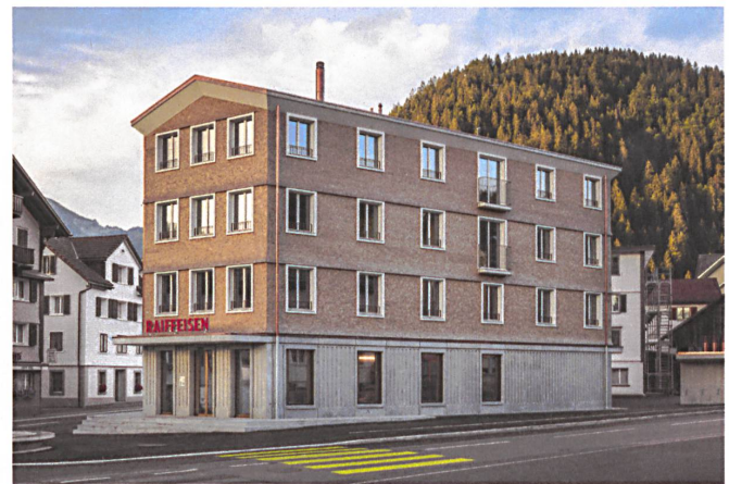
28 Die Raiffeisenbank steht im Zentrum von Unterberg.