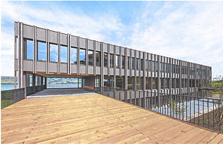
27 Der Neubau erweitert die Schulanlage in Nottwil über dem Sempachersee.