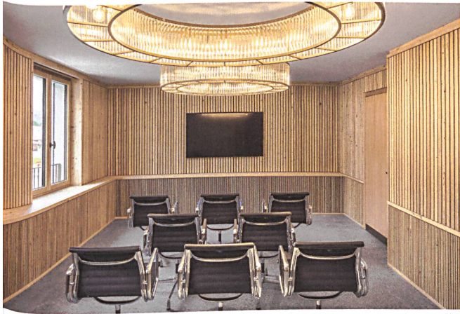
28 Die Sitzungszimmer schmückt ein Kleid aus Lärchenlamellen aus.

entlang der Fassade zieht. So übersetzt der Innenausbau die konstruktive Logik in Atmosphäre. Die Bank unterstreicht damit ihre Nähe zu den Kunden, die sich in den Zimmern fast wie in der guten Stube fühlen. Die Architekten entwerfen mit Gespür und Können. Sie passen das Gebäude städtebaulich sensibel ein und verknüpfen Massiv- und Holzbau überzeugend. Die Fassade feiert Holz innen, aussen und in der Konstruktion. Der Bau unterstreicht, wie vielfältig sich Holz verwenden und kombinieren lässt.