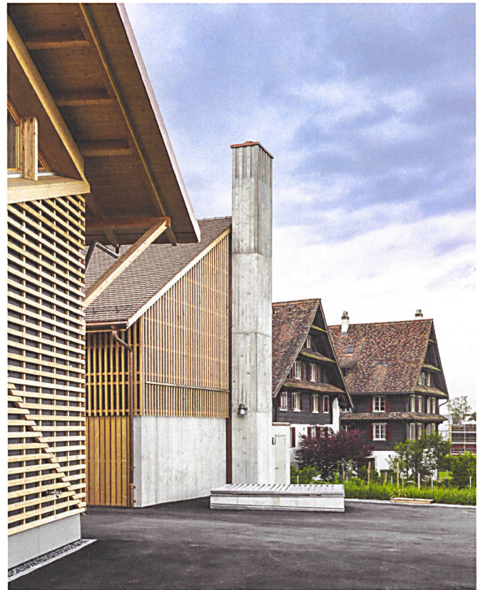
29 Die zwei Neubauten in Zug ersetzen den Bestand der Sechzigerjahre.