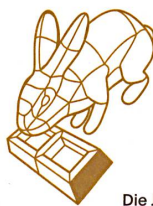
Die Jury sagt