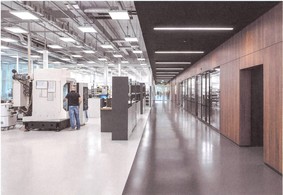
Mitverfolgen, wie eine Uhr entsteht: Auf den grauen Wegen gehen die Besucherinnen und Besucher, auf den weissen Flächen wird gearbeitet.