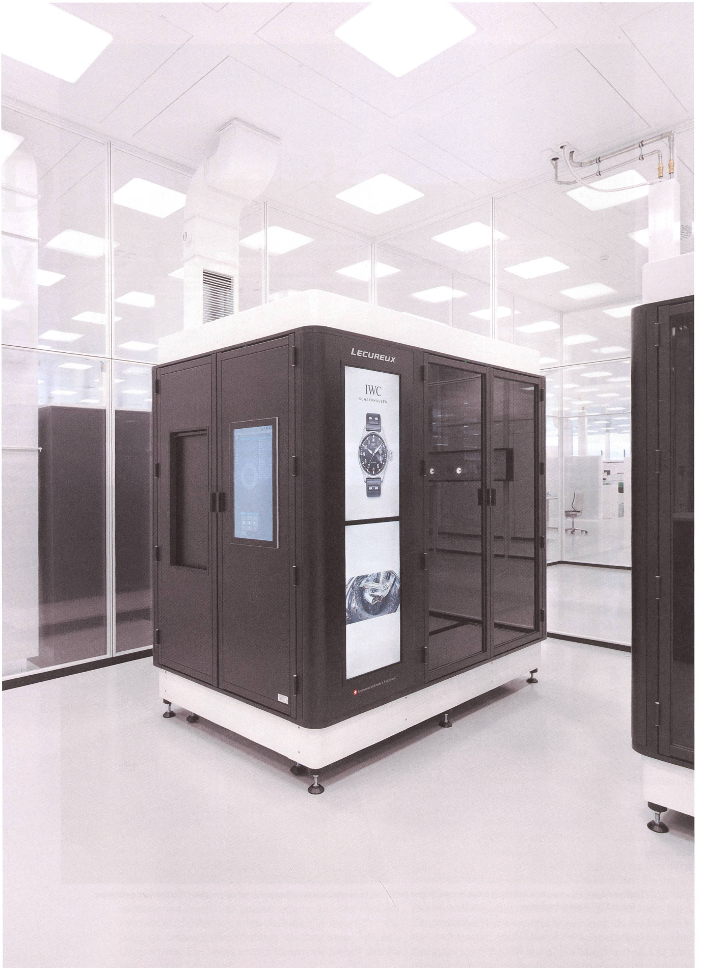
Die neue Chronometriezelle in Schaffhausen wurde in Biel von Designer Damien Regamey entworfen und von Hersteller Lécureux gefertigt.