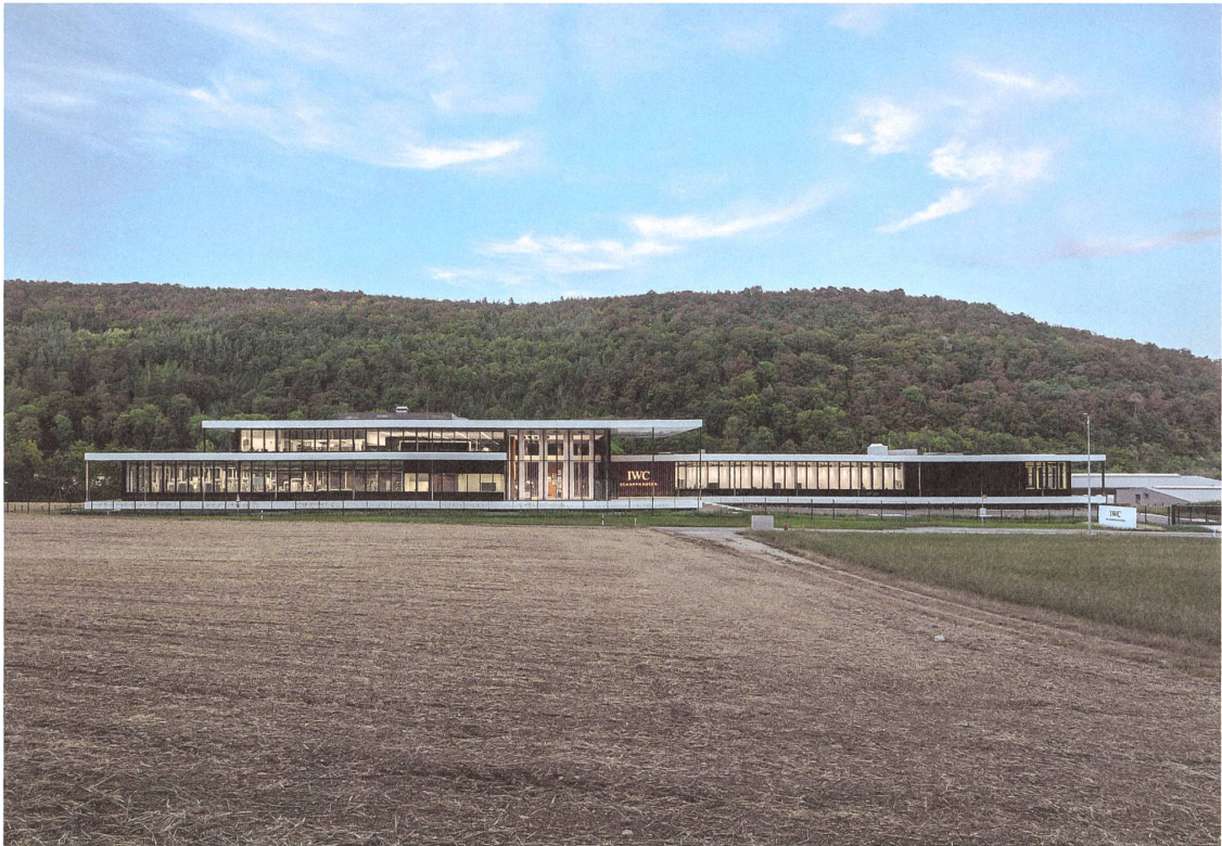
Die neue IWC-Produktionsstätte in Schaffhausen führt die Fertigung von rohen Werkstücken und Gehäusen an einem Ort zusammen.