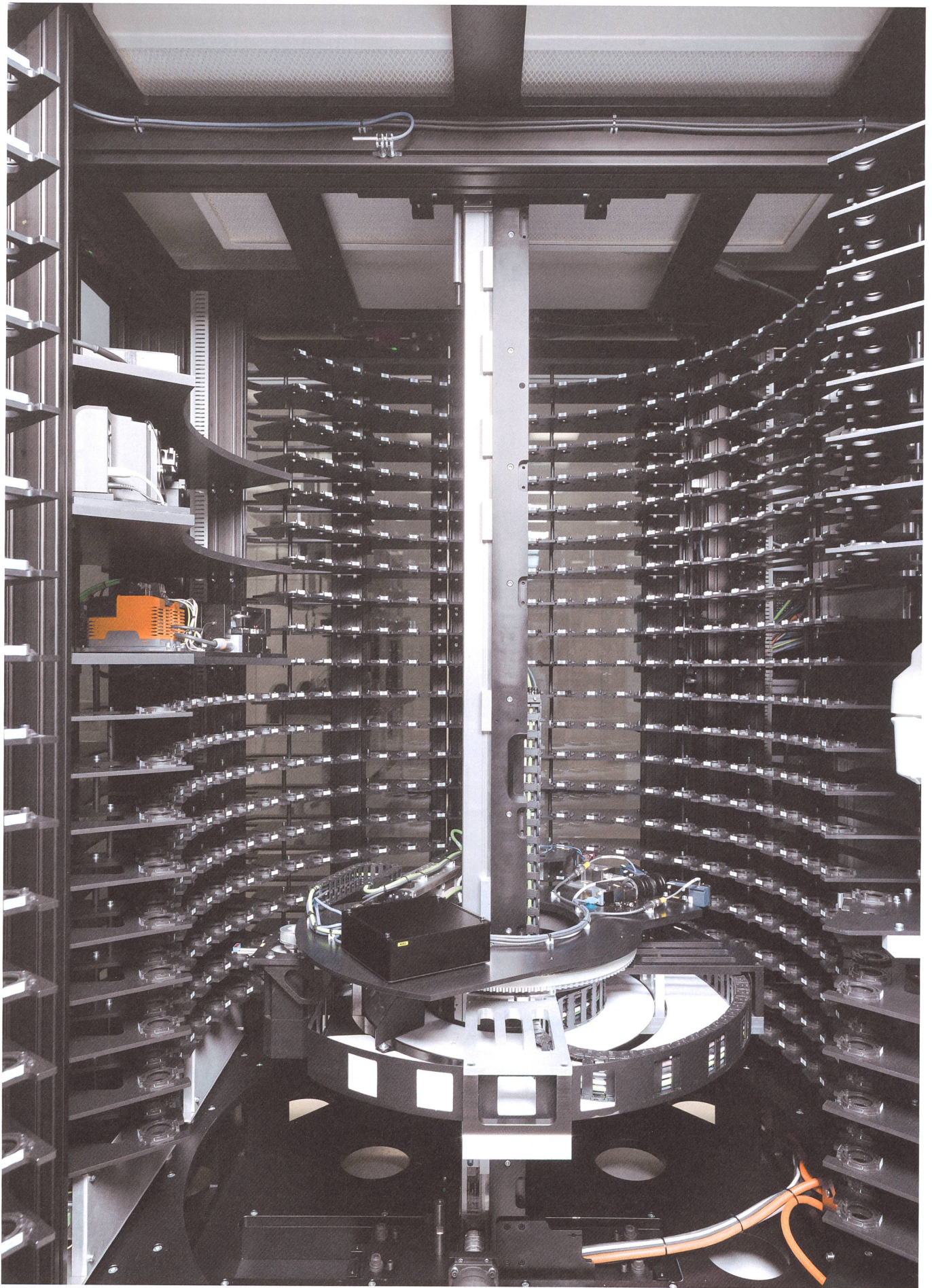
Im Innern der Zelle: Bis zu 900 Uhrwerke testet IWC hier aufs Mal auf ihre Qualität.