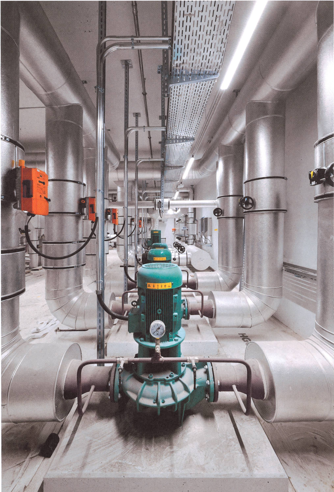
Die Energiezentrale Pont-Rouge in Genf verteilt Energie aus 300 Erdsonden. | La centrale énergétique Pont-Rouge de Genève distribue l'énergie qui provient de 300 sondes géothermiques.