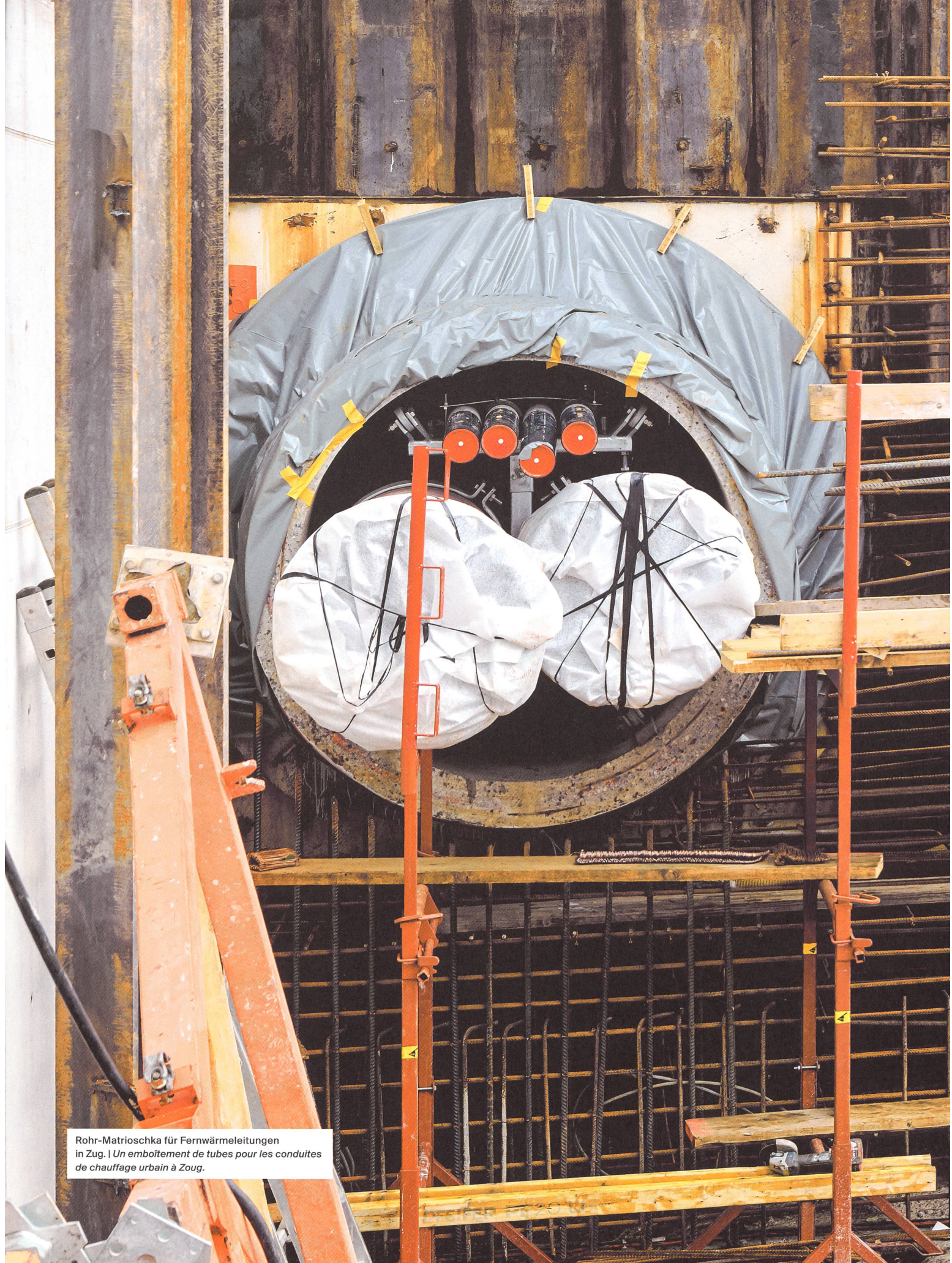
Rohr-Matroschka für Fernwärmeleitungen in Zug. | Un emboîtement de tubes pour les conduites de chauffage urbain à Zoug.