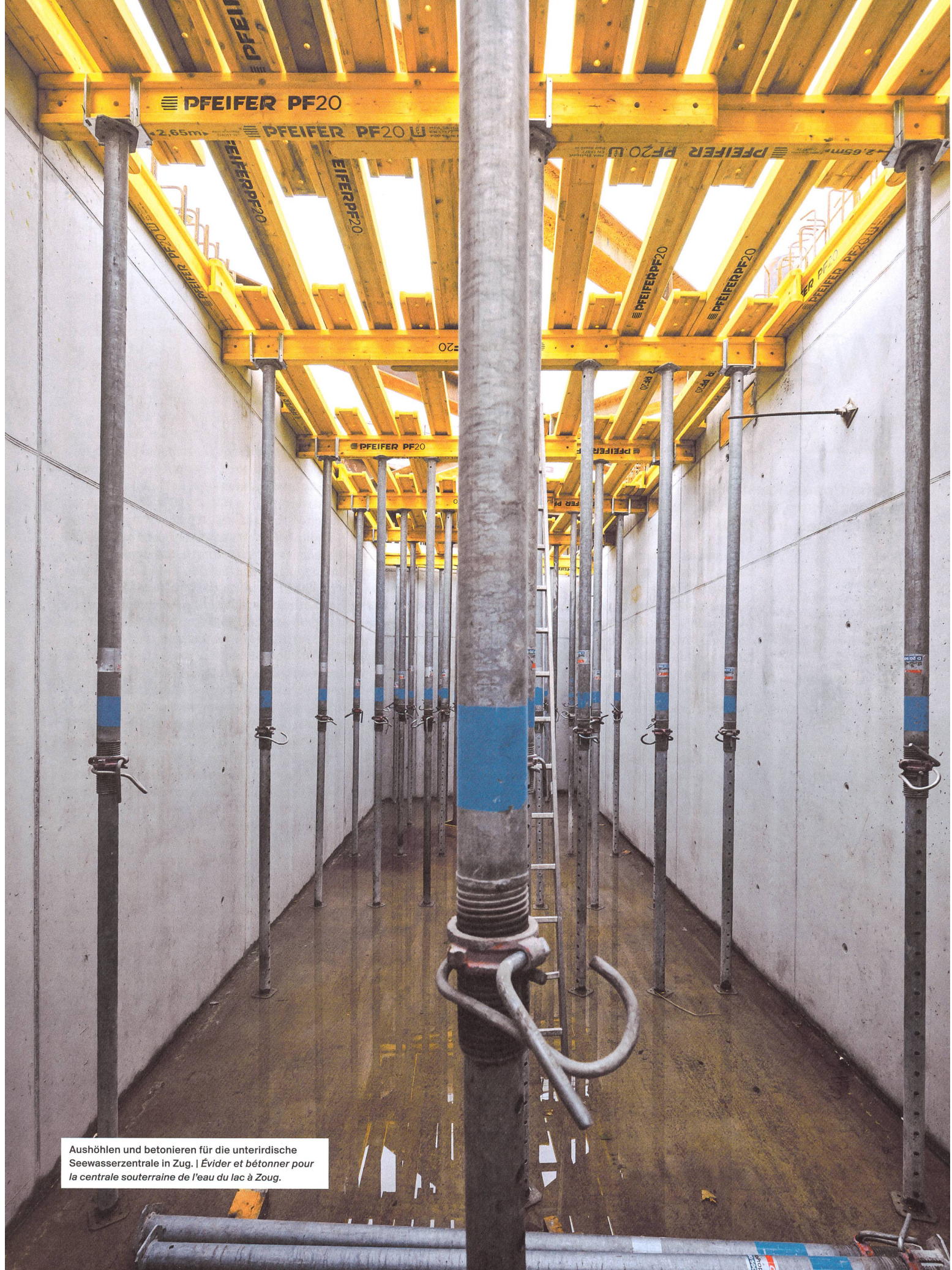
Aushöhlen und betonieren für die unterirdische Seewasserzentrale in Zug. | Évider et bétonner pour la centrale souterraine de l'eau du lac à Zug.